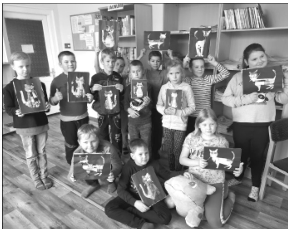
Tilžas vidusskolas 3.klase. Viņi izdomāja dzīvniekus, kurus neviens nav redzējis, un bērnu iztēle pārsteidza pat bibliotekāri.

Interesantas bija arī tikšanās 23.septembrī ar Tilžas vidusskolas 5. un 6. klases skolēniem. "Kopīgi lasījām dzejoļus no grāmatas "Zvēri, kurus neviens nav redzējis". Tā kā dzejoļos dzīvniekiem piemīt dažādas cilvēkiem raksturīgas īpašības, tad sarunās mēģinājām tās atšifrēt. Dzejojli "Divdabietis" pārrunājām, cik dažādi var būt ārējie apstākļi, kas ietekmē mūsu emocijas. Vai ir iespējams, ka vieni un tie paši notikumi visiem cilvēkiem izraisa vienādas emocijas? Praktiskajos darbos katra