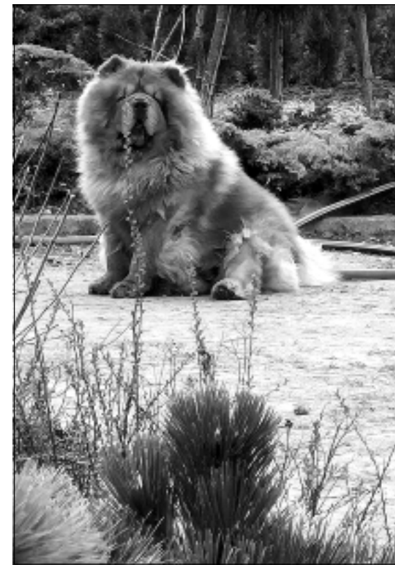
Sargs. Suns Reno ne tikai sargā plašo teritoriju, bet ir arī uzticams draugs saviem saimniekiem.