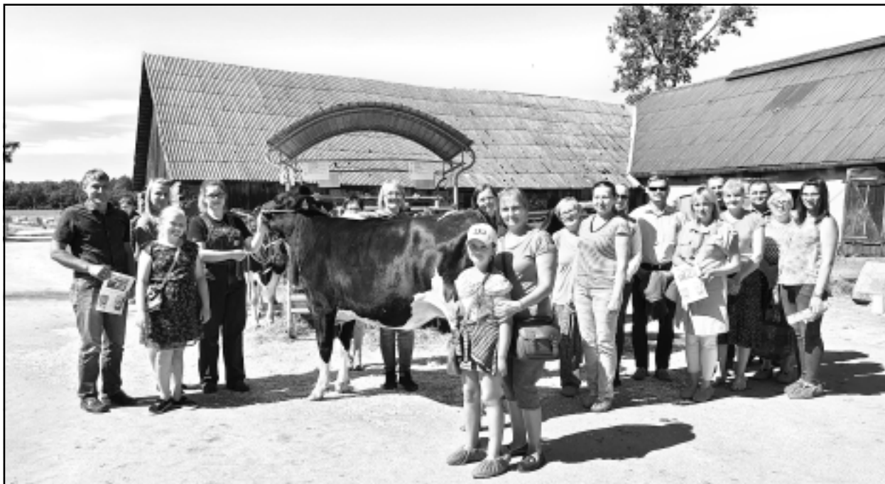
Praktiskā daļa. Lauku dienas apmeklētāji apskatīja saimniecību un ieguva vērtīgu informāciju, kas noderēs ikdienas darbā.

Pēc teorētiskās daļas pasākuma apmeklētāji devās uz Riebiņu novada Galēnu pagasta piena lopkopības saimniecību SIA "Gribolva", kur slauc vairāk nekā 80 augstāzīgas Holštei-