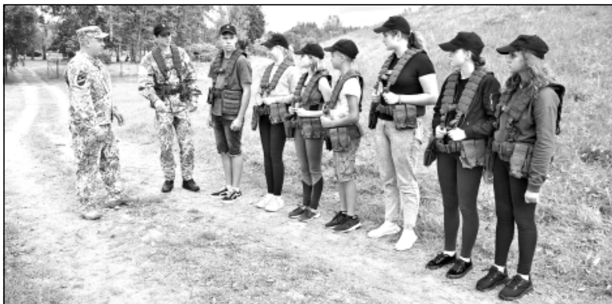
Kas ir čārlijs? Uz šādu jautājumu, kā zināja teikt jaunieši, atbildi radīs tie, kas iestāsies jaunsardzē.