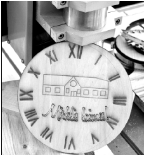
Koka pulkstenis. Uzņēmuma produkcija - koka pulkstenis ar uzrakstu "Mirkli laimes".