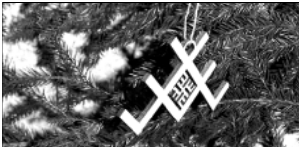
Latvju zīme. Uzņēmumā "Baltic Presents" gatavotās koka latvju zīmes Ziemassvētkos rotāja arī svētku egles.

Latvijā ir zemāka pirktspēja. "Neteikšu, ka arī Anglijā mūs sagaida ar atplestām rokām. Taču tur ir vairāk cilvēku, lielāka pirktspēja. Katrs jauninājums tirgū rada interesi, turklāt mums ir konkrēta vieta, kur varam savu produkciju piedāvāt un tirgot. Tas ir svarīgi! Jo atrast tukšā vietā sadarbības partnerus ir grūti, - vienalga, Latvijā vai citviet," atzīst ne tikai kokapstrādes, bet arī speciāliste eksporta jautājumos.