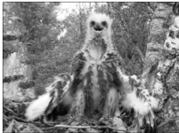
Mazais ērglis. Dabas parks ir viena no nozīmīgākajām mazā ērgļa ligzdošanas vietām Latvijā.

Dabas parks "Vecumu meži" atrodas Viļakas novada Vecumu un Žiguru pagastu teritorijā. Tā kopējā platība ir 7842 ha, dibināts 2004.gadā. Dabas parks ir viena no nozīmīgākajām mazā ērgļa ligzdošanas vietām Latvijā. Te sastopamas gandrīz visas Latvijā aizsargājamās dzeņu sugas. Ievērojama dabas vērtība šeit ir slapjie meži, it īpaši melnalkšņu staignāji, kas sastopami lielos masīvos un kuros ligzdo un barojas reto sugu dzeņi. Ļoti vērtīgas ir mežaudzes ar vecām apsēm, kas kalpo par ligzdas kokiem melnajam stārķim un mazajam ērglim. Šajos mežos ir liels aizsargājams un ļoti retu sūnu, ķērpju, sēņu un kukaiņu sugu skaits.