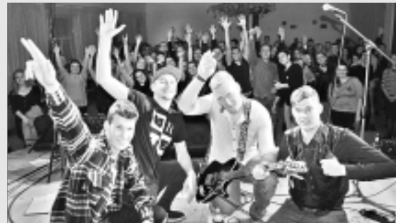
“Unknown Artist”. Grupas “Unknown Artist” mūziķiem festivālā Upītē fanu nūdien netrūka!

Pazīstamais mūziķis piebilst, ka arī viņa dzimtas saknes meklējamas Latgalē - tētis ir no Preiļu puses, Stabulniekiem, bet mamma vecāki nāk no Andrupenes, Ļoļu ciema. Savukārt jautāts, kas R.Kauperu pašlaik nodarbina visvairāk, mūziķis stāsta, ka šobrīd notiek aktīva “Prāta Vētras” jaunā albuma sagatavošana, kas iznāks nākamgad. “Būs arī koncerti Latvijā, daudz sadarbības ar citiem māksliniekiem. Domāju, par to visu dzirdēsiet vistuvākajā laikā. Drīzumā arī viesošos Rēzeknē, “Gorā”, ar programmu bērniem, kas gatavota kopā ar Ivetu Apkalnu un “Gora” radošo komandu,” tuvos nākotnes plānus lasītājiem atklāj R.Kaupers.