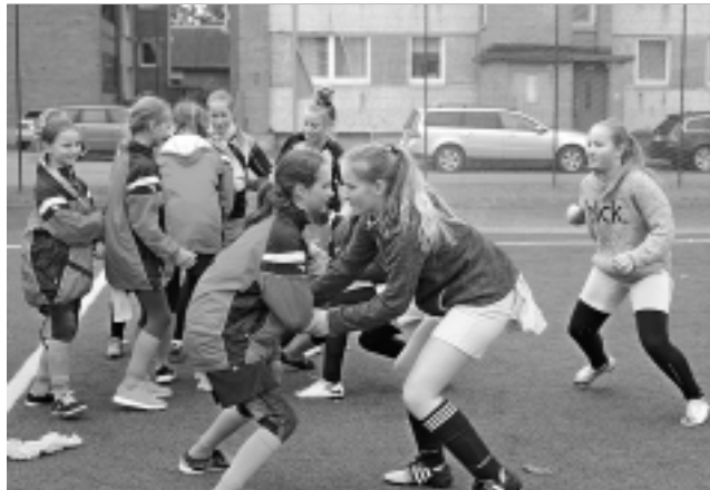
Mācās būt agresīvākas. Spēlē, kuras laikā meitenēm bija jānorauj pretiniecēm piespraustie divieļi, mazās sportistes apguva vienu no grūtākajām mācībām – nebaidīties no saskarsmes.