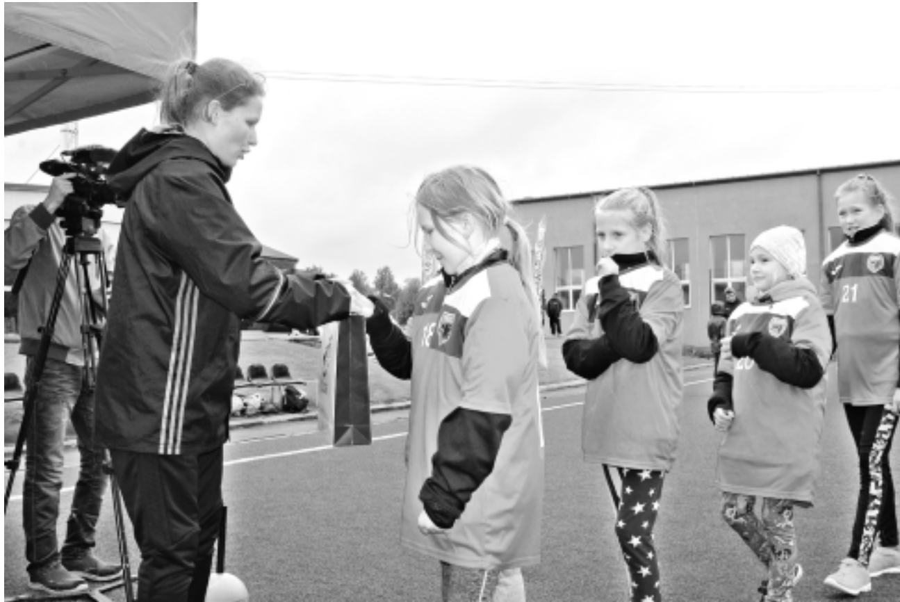
Iepriecina ar mazām vēltēm. Jaunās sportistes jutās pagodinātas, saņemot Latvijas sieviešu futbola izlases spēlētājas pasniegtās nelielās veltes. Jo kurai daiļā dzimuma pārstāvei gan nepatīk saņemt dāvanas?!