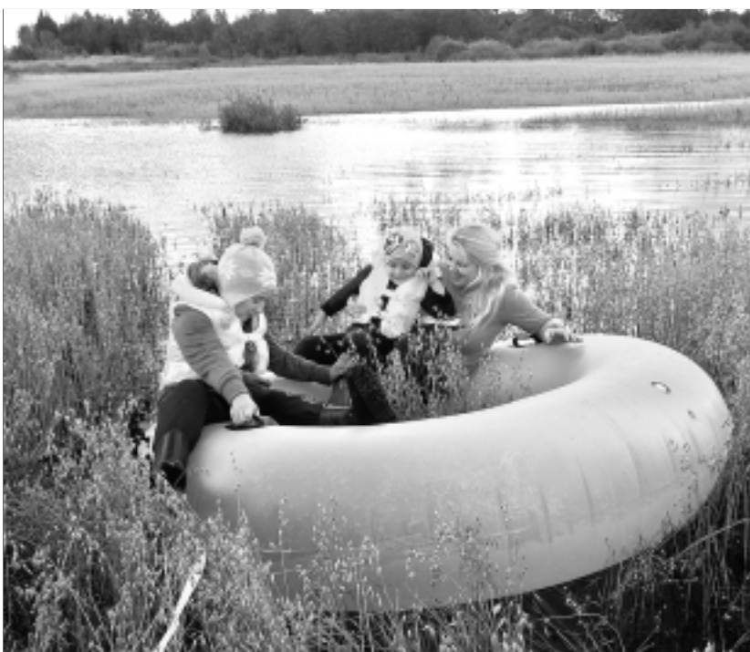
Laivotāji. Lietavu pārbagātību laukos var izmantot arī šādi.