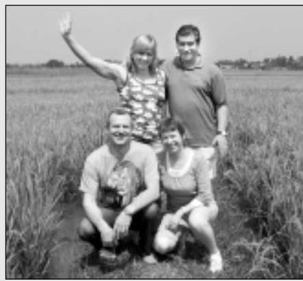
Iepazīst Vjetnamas cilvēkus un izbauda eksotiku.