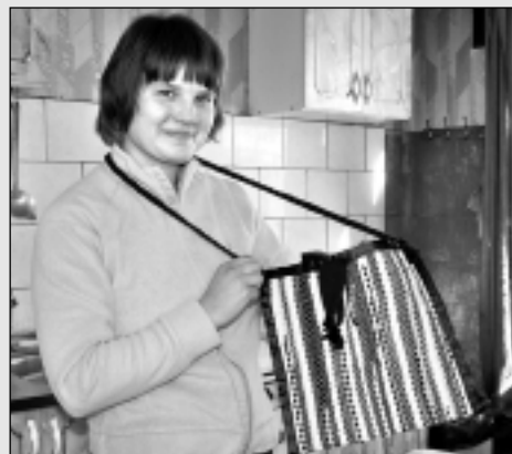
Dzīvē viss noticis uz labu.