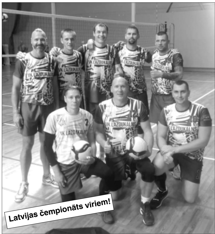
Latvijas čempionāts vīriem!

Šī mēneša sākumā lielas ceļasomas kārtoja VK "Lazdukalns/Balvu novads" vīru komanda (attēlā), jo, lai nokļūtu līdz galapunktam, bija jāšķērso visa Latvija. Proti, 2.novembrī tālajā Kurzemes pilsētā Ventspilī tika dots starta šāviens Latvijas čempionātam, kurā lazdukalnieši spēlēja vecuma grupā "Vīrieši 40+". Pirmie pretinieki mūspuses volejbolistiem bija "Poliurs/Jelgavas novads" komanda, kuru VK "Lazdukalns" apspēlēja divos setos – 2:0. Savukārt otrajā cīņā nācās iesvist krietni vairāk, par ko parūpējās sīkstie volejbolisti no "Jēkabpils SC". Diemžēl šoreiz sīva trīs setu cīņā ar rezultātu 1:2 nācās piekāpties.