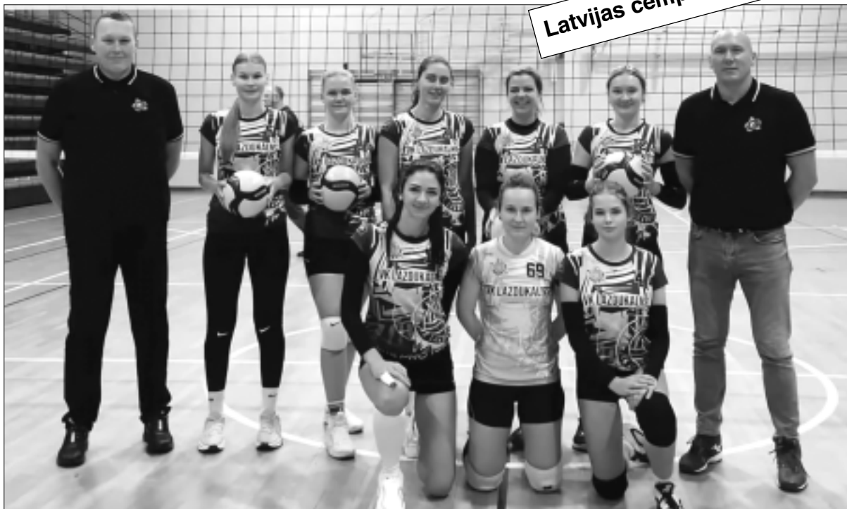
Latvijas čempionāts dāmām!