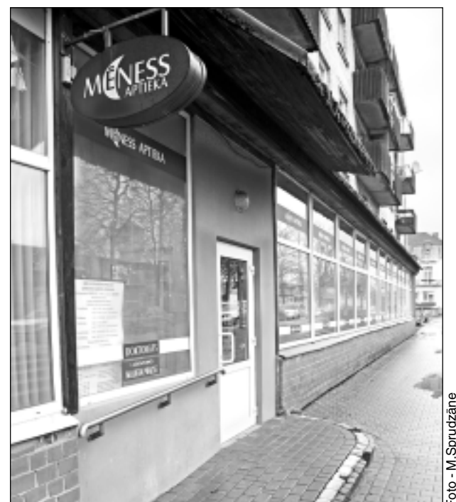
Kā gan bez aptiekas! Balvos aptiekas ir četrās vietās, un visām tām ir klienti, jo bez farmācijas pakalpojumiem mēs neviens nevaram iztikt.