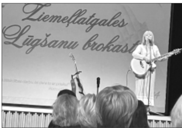
Dzied Ieva Akuratere. Lūgšanu brokastu viesis bija viena no Latvijas neatkarības un atmodas simboliem – mūziķe Ieva Akuratere.