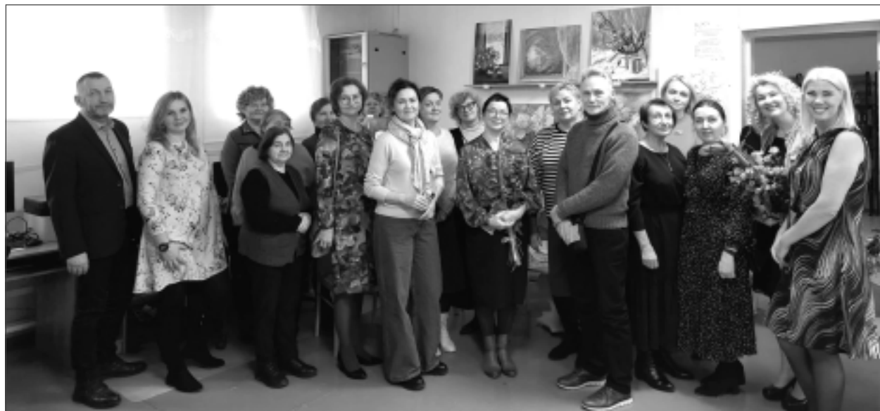
Mākslinieki un viņu fani. Izstādes atklāšanā satikties ar studijas gleznotājiem ieradās daudzi viņu atbalstītāji un iedzīvotāji, kuriem māksla nav vienaldzīga.