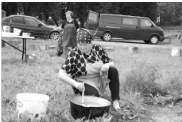
Top krēmzupa. Par to, kā ierasts, parūpējās sievietes biedrība “Vaivariņi”.