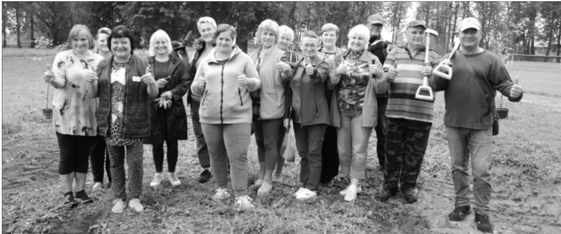
Talcinieki. Koku stādīšana norisinājās strauji. “Ātrāk pie zupas katla tiksīm,” vīri jokoja.