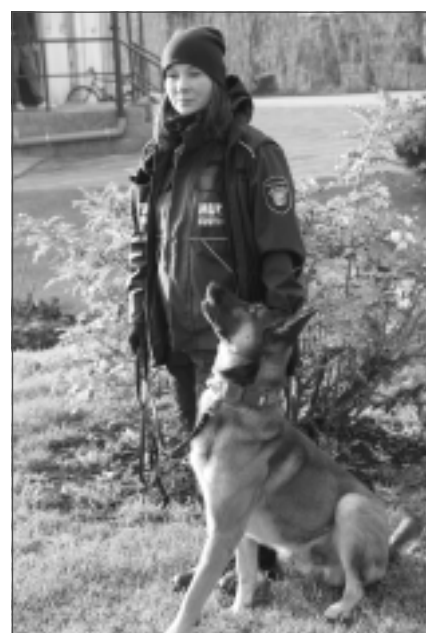
Klausa saimnieku. Marina (no Ventpils) ar suni rādīja, kā sadarboties ar četrkājaino draugu, lai tas klausītu saimnieku, demonstrējot, kā sunim jāstaigā blakus. V.Bikovskis taujāja klātesošajiem, kādēļ suns klausās un kas ir viņa motivācija,

paskaidrojot, ka sunim interesē bumba un citreiz arī gardums, ko viņš saņem balvā par klausīšanu.