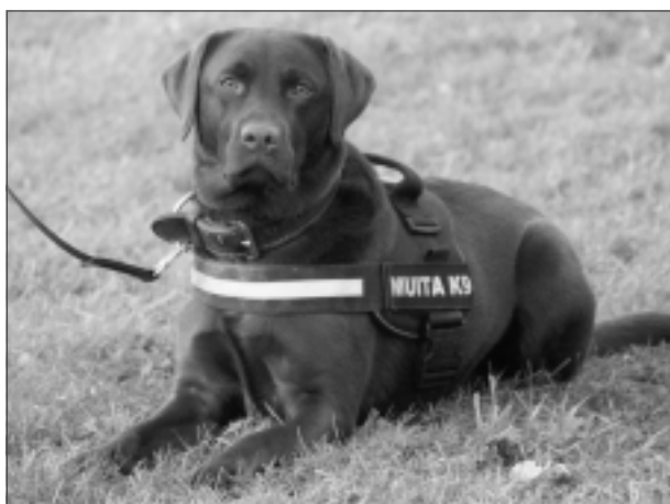
Dienesta suns. Muitā, kā pastāstīja V.Bikovskis, suņus iepērk no 6 mēnešu vecuma, pamatapmācība ilgst četrus mēnešus. Sunis jāsāk mācīt, tiklīdz viņš ir pie kinologa vai cita saimnieka, nav svarīgi, kādā vecumā to iegādājaties. Klātesošie uzdeva kinologiem vairākus jautājumus, piemēram, par to, cik ilgi suns jāmāca. Izrādās, visu laiku, sākot no 6–8 nedēļu vecuma. Kādas šķirnes suņus vieglāk apmācīt? Iemācīt var jebkuru suni, bet plašāk izmanto beļģu aitu suņu šķirni (vācu aitu suņiem bieži vien ir veselības problēmas), protams, viss ir individuāli – atkarīgs no suņa un cilvēka. Suņa apmācībai muitā atsevišķu naudas summu neparedz, izmaksas ir tikai kinologa alga un aptuveni 70 eiro mēnesī, kas paredzēta suņa uzturēšanai. Muitā suņi dzīvo tikai pie kinologa, kur ir jābūt apstākļiem, lai varētu nodrošināt suņa turēšanu mājās. Sunis strādā 8–12 gadus (atkarīgs no veselības un darba spējām). Kas notiek, ja suns beidz dienesta gaitas? Viņš paliek kinologa aprūpē. Ir kinologi, kuriem ir divi suņi (viens, kurš ir aprūpē, un otrs ir jaunais darba suns). Ir suņi, kuri meklē narkotikas un naudu, bet pārsvarā katrs suns meklē kaut ko vienu.