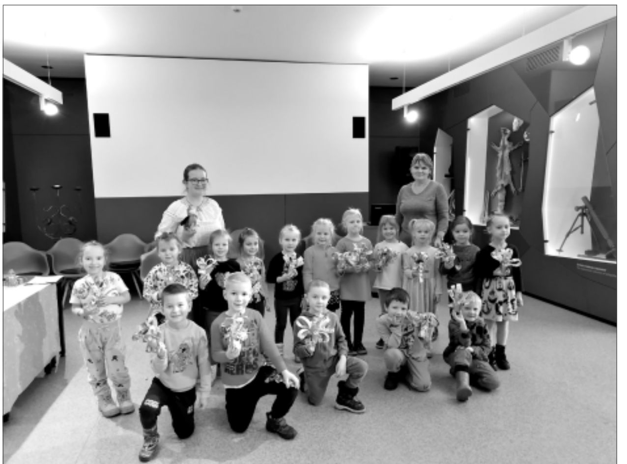
Senlatviešu tradīciju turpinātāji. Īsi pirms Mārtingaiņu muzejā ciemojās PII "Pīlādžītis" bērni, kuri pēc nodarbības bija ne vien vairāk uzzinājuši par Mārtingaiņu tradīcijām, bet izgatavojuši arī katrs savu svētku simbolu – gailīti.