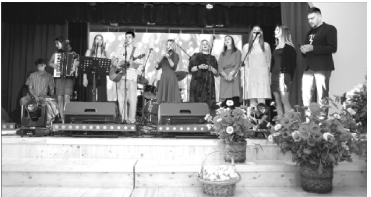
Folkloras kopa "Upīte". Festivāla atklāšana, pirmkārt, nav iedomājama bez Upītes pašdarbnieku uzstāšanās. Otrkārt, bez festivāla himnas, izskanot vārdiem: "...Kur vēl citur tā ābeles zied?"