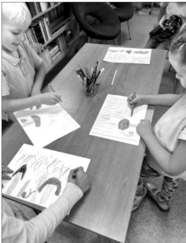
Patik zīmēt. 1.klases skolēni iejutās grāmatu ilustratoru lomā.