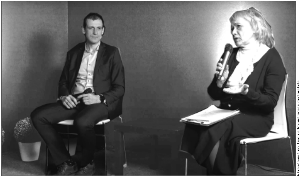
Ekranšāviņš no Tiesu administrācijas raidieraksta