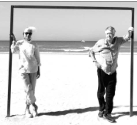
Brīvbrīdi sagatavoja Z.Logina