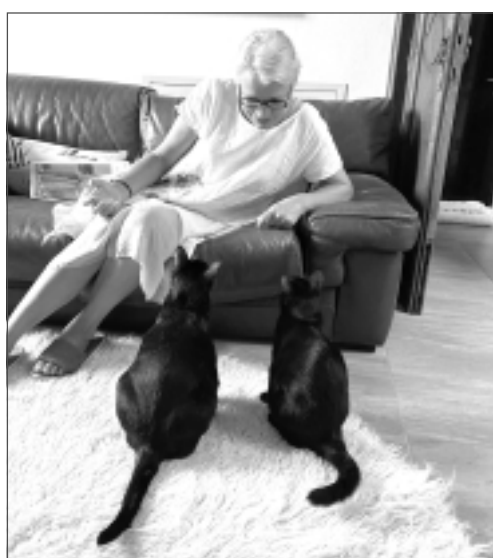
Melnie skaistuli. Pozņaki Itālijas pilsētiņā Faenza pieskatīja divus kaķus – Cosmos un Pistacio.