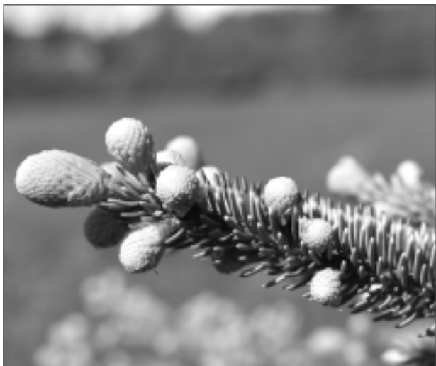
Egles pumpuri. Melnās egles ( Picea marina aurea ) plaukstošie pumpuri.