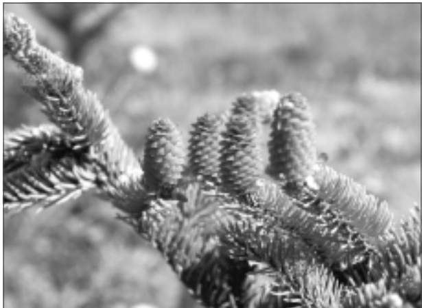
Zied egle. Ar sarkaniem vertikāliem strobilēm (tā pareizi sauc kokaugu ziedus) zied parastā egle.