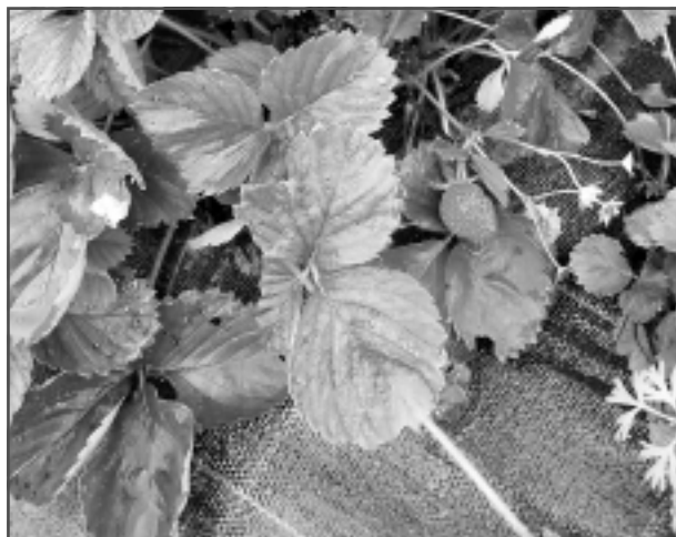
2020.gada 30.septembris – brīnumiņš manā dārzā. Iesūtīja Irēna Svilāne.

Katra mēneša labākās fotogrāfijas autors saņems balvu. Fotogrāfijas var iesūtīt pa pastu – Balvi, Teātra ielā 8, LV-4501, vai elektroniski – vaduguns@apollo.lv. Pie foto obligāti norādāms vārds, uzvārds (vēlams - tālrunis).