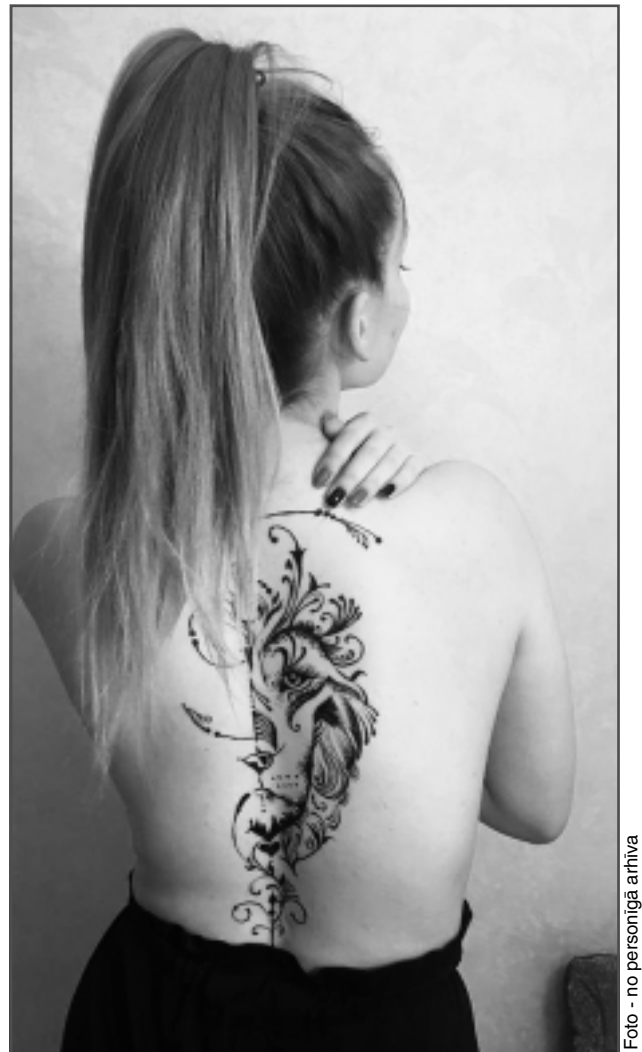
Kitijas roku darbs. Hennas tetovējums uz draudzenes muguras.

sava izvēle, es nenosodu tos, kas pilnībā notetovē savu ķermeni. Tas nav dīvaini, vienkārši mēs to nemēdzam bieži redzēt, tādēļ tam pievēršam īpašu uzmanību. Tas ir katra paša lēmums.