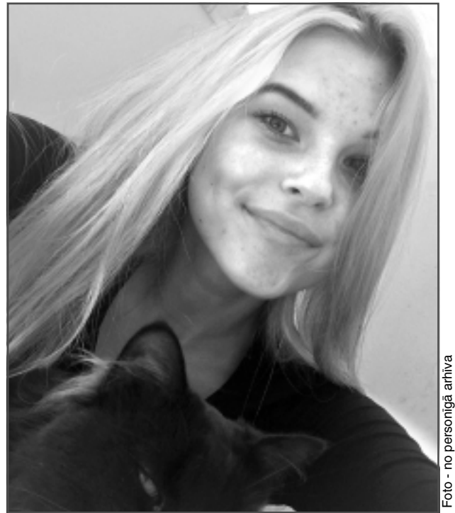
Kitija ar kaķi. No mājdzīvniekiem Kitijai ir tikai kaķi, jo viņai pašai šķiet, ka izjūt ar tiem līdzību.

-Agrāk, pirms ieguvu savu pirmo, cerams, ne pēdējo tetovējumu, nodarbojos aktīvi ar hennas zīmēšanu. Bija pat tādas nedēļas, kad gan es, gan mani draugi staigāja, noklāti ar melno un brūno hennas krāsu uz rokām un kājām. Tagad uz sava ķermeņa man ir mazs, bet redzams tetovējums. Nākotnē vēlos vēl, tas nav noslēpums. Mūsdienās mums ir katram