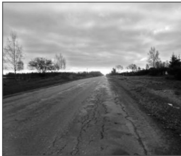
Ceļā uz saulrietu. Iesūtīja Ilvars Vizulis.

Katra mēneša labākās fotogrāfijas autors saņems balvu. Fotogrāfijas var iesūtīt pa pastu - Balvi, Teātra ielā 8, LV-4501, vai elektroniski - vaduguns@apollo.lv. Pie foto obligāti norādāms vārds, uzvārds (vēlams - tālrunis).