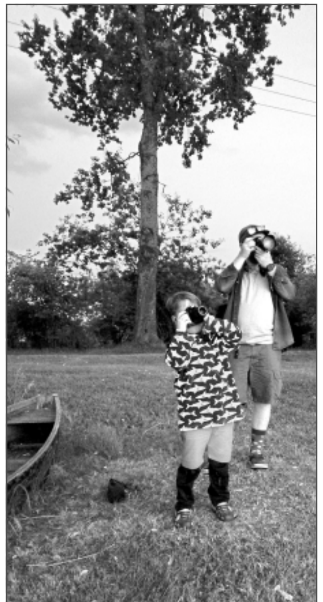
Fotogrāfi. Iesūtīja Dace Teilāne no Balviem.