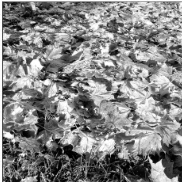
Lapkritis. Iesūtīja Rūdolfs Kozlovs.