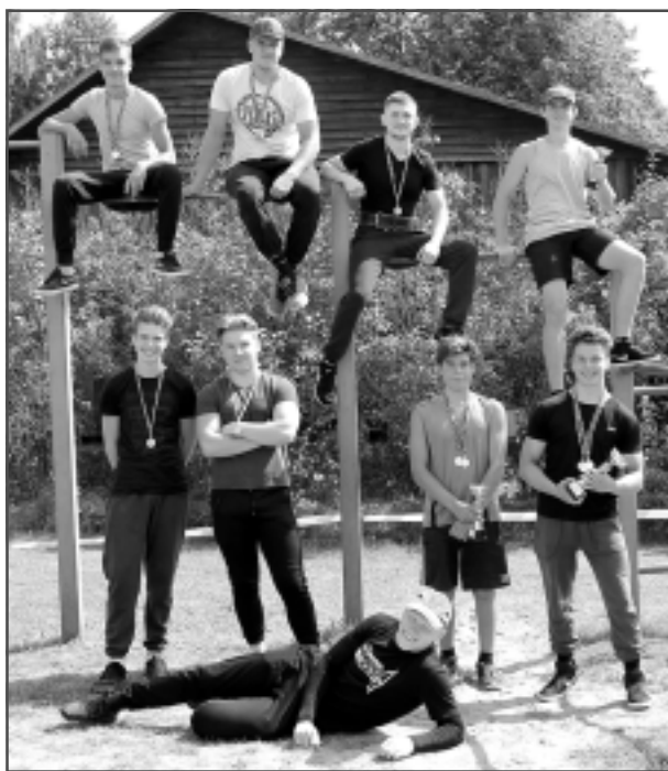
Ielu vingrotāju paradīze. Īstenojot projektu un piepalīdzot pašiem, pirms vairākiem gadiem pie jauniešu centra tapis ielu vingrošanas laukums.