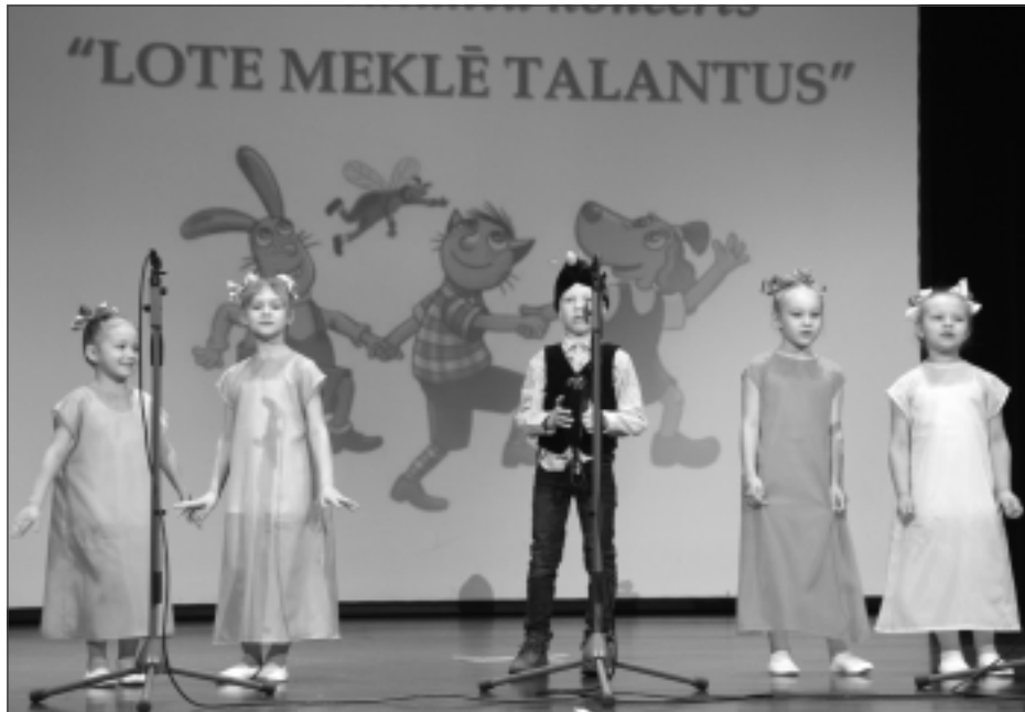
Atklāj koncertu. Kubulu pirmsskolas izglītības iestādes "Ieviņa" grupiņas "Bitītes" bērni pierādīja, ka mīļa "Lotes dziesma". Tāpat viņi sarūpēja pat kurmja cienīgu pārsteigumu.