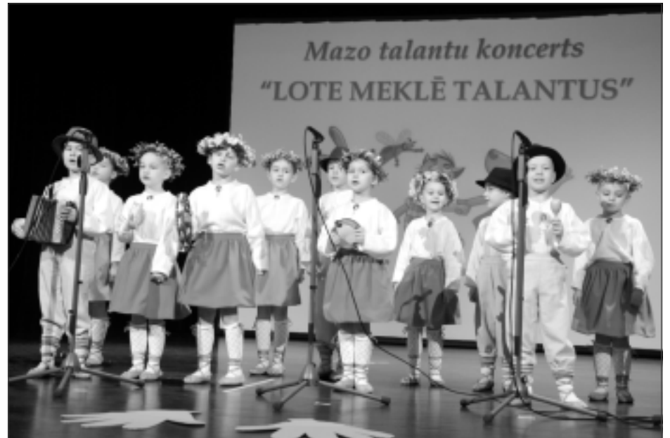
Kur meklējama atbilde? Ja vēlaties noskaidrot, kurš muzikālais instruments skaistu dziesmu dzied, droši dodieties uz Viļakas pirmsskolas izglītības iestādi "Namiņš", turklāt tur bērni ne tikai dzied, bet arī atraktīvi dejo.