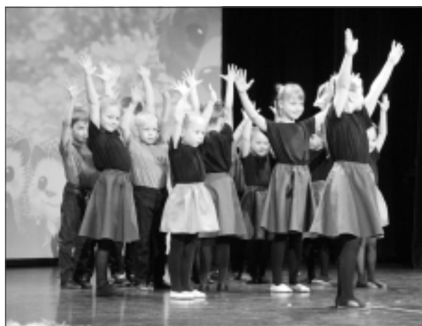
Kā mazi eziši. Rekavas vidusskolas pirmsskolas audzēkņi neslēpa, ka ir braši dejotāji un dziedātāji.