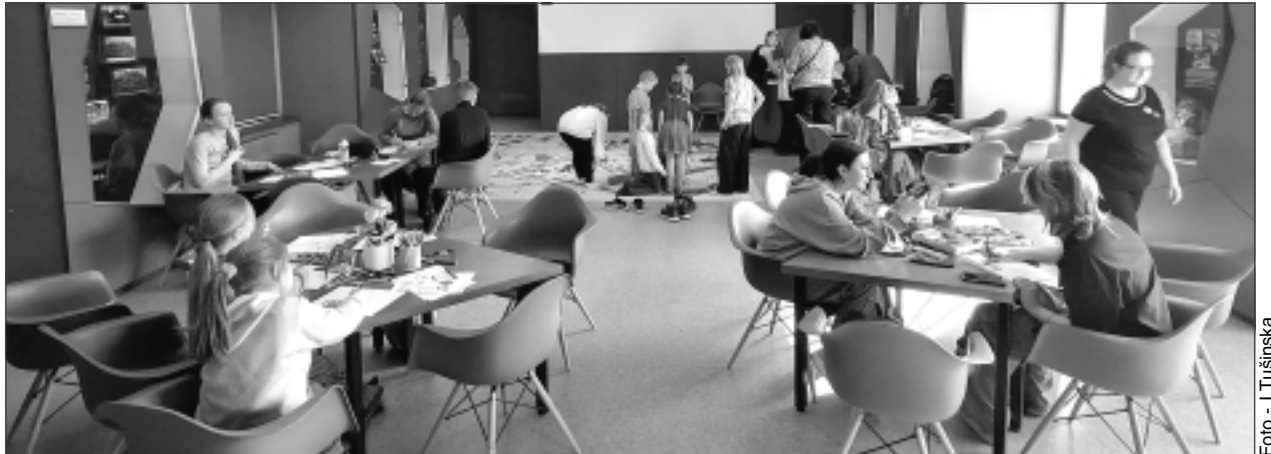
Satiek draugus un apgūst jaunas prasmes. Balvu Novada muzejā rīkotās skolēnu brīvlaika aktivitātes ieguvušas lielu popularitāti gan bērnu, gan viņu vecāku vidū. Tajās ne tikai var apgūt kaut ko jaunu, bet arī jautri pavadīt laiku kopā ar draugiem.

Lai gan Rīgā notiek daudz dažādu brīvlaika aktivitāšu, Balvos tās apmeklēt ir vienkāršāk, jo attālumi nav tik lieli. "Balvos ir interesantāk. Rīgā satikties ir daudz grūtāk, jo viens dzīvo vienā pilsētas galā, otrs – otrā," paskaidroja jaunietais. Esot Balvos, meitenes nereti iesaistās arī dažādās meistardarbnīcās, ko rīko salons "Azote". Māsiņas atklāja, ka Balvos viņām ļoti patīk. Te viņas daudz laika pavada