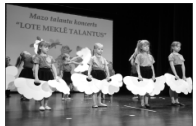
Gan runā dzejā, gan griežas dejā. Apburošu ziedu deju demonstrēja Rugāju vidusskolas grupiņas "Knariņi" bērni.