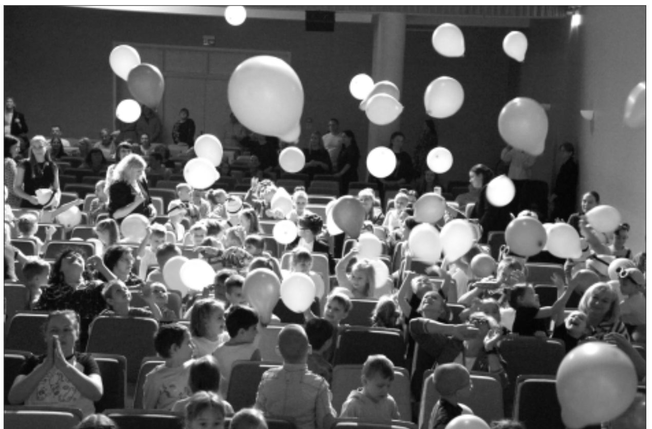
Lai lido! Viennozīmīgi jāsecina, ka talantu koncerts nevar noslēgties netalantīgi. Epilogā – gaisa balonu salūts.