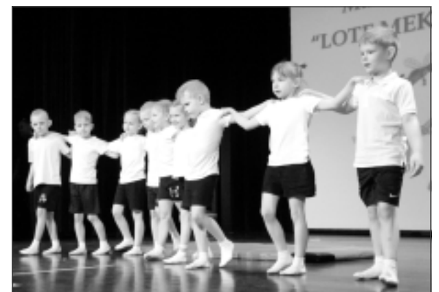
Lec, veļ kūleņus... Balvu pirmsskolas izglītības iestādes "Sienāzītis" audzēkņi apliecināja, ka ir profesionāli akrobāti.