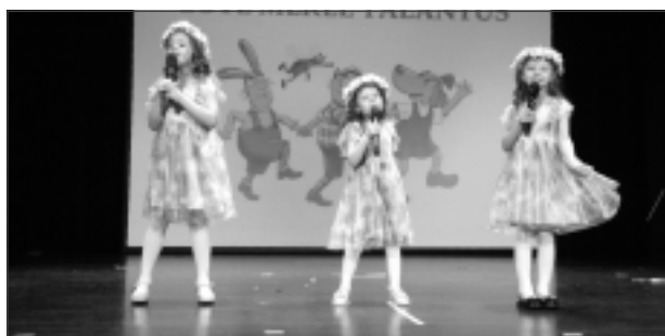
Trio. Tilžas pamatskolas grupiņas "Ežuki" solistes dziesmā apliecināja, ka mūsos katrā dārgums mīt.