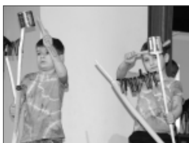
Kas tos Balvus dimdināja? Bērzkalnes "Taurenīši" pārsteidza ar to, ka dejojot ar ceļgaliem var arī konserva bundžiņu skaņu pavadījumā.