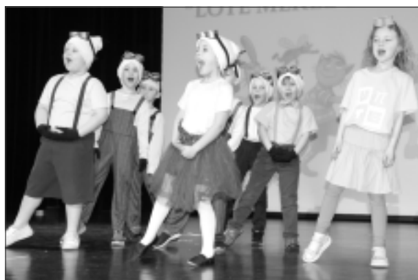
Kā multfilmā. Baltinavas vidusskolas pirmsskolas bērni priecēja ar "Minjonu deju".