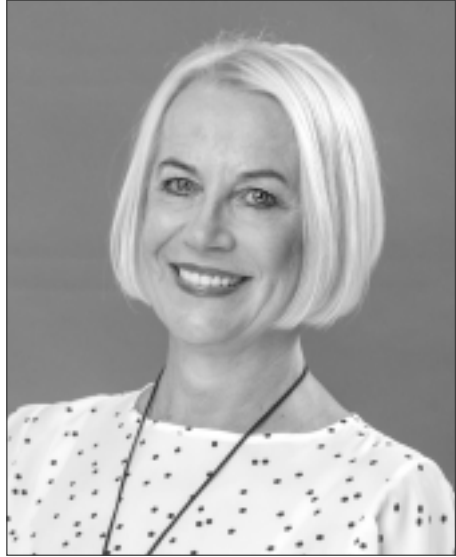
LĪGA KOZLOVSKA, Saeimas deputāte, ģimenes ārste

Izmaiņas Darba likumā tapušas tādēļ, ka Latvija ir vienīgā valsts Eiropas Savienībā, kur virsstundas apmaksā 100% apmērā. Protams, par to, lai šis regulējums tiktu ieviests (kaut vai pakāpeniski), pamatā iestājas darba devēji. Svarīgi panākt, lai darba līgumā vai koplīgumā ir skaidri atrunāts, cik liela alga darbiniekam paredzēta, savukārt samaksai par virsstundām jābūt tikai īpašos gadījumos, kad notiek patiešām kaut kas neparedzēts un neatliekams. Kā zināms, Latvija starp citām Eiropas Savienības dalībvalstīm izceļas ar fak-