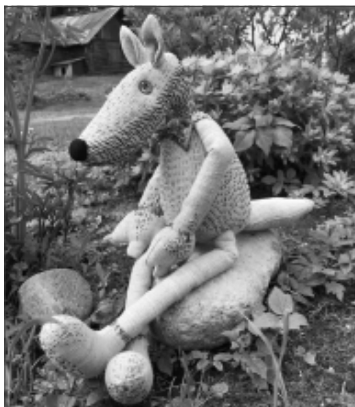
Balvu vilciņš. Šo Balvu pilsētas simbolu pasūtīja balveniete Ilga.