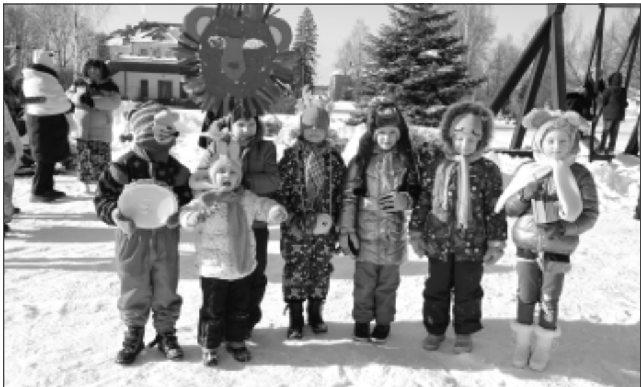
Ķekatrieki. Mazie bērnpilieši apliecināja, ka maskošānās prieks ir nozīmīgs arī mūsdienās.