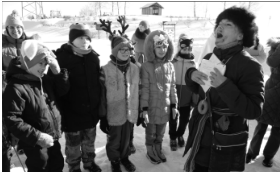
Uzmini nu! "Bez rokām, bez kājām, bet tiltu taisa."

Kas uzvarēs? Divas bērnu komandas "Pavasaris" un "Ziema", velkot striķi, kāroja noskaidrot, kas uzvarēs. "Neizšķirts, būs vēl auksti," secināja pieaugušie, redzot, ka striķis pirmajā sekundē pārtrūka.