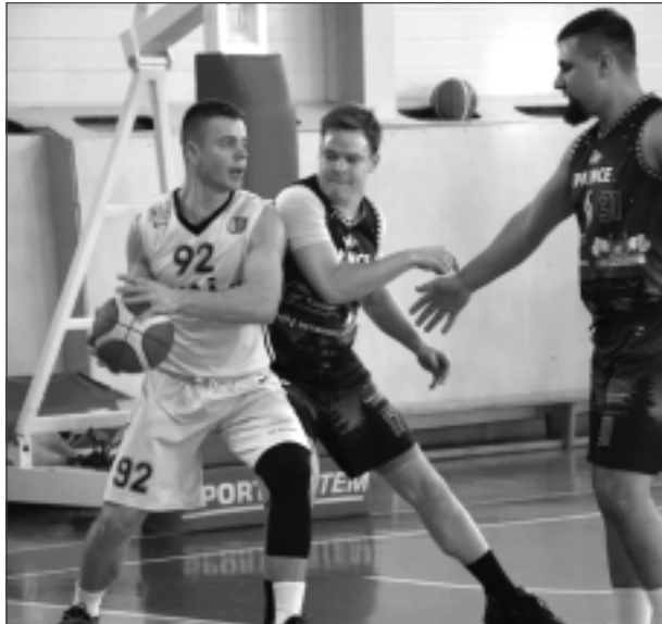
Ciņa. Droši paredzēt komandu, kura šogad triumfēs čempionātā, nevar.

Par otrā posma spēļu rezultātiem ziņosim kādā no nākamajiem laikraksta "Vaduguns" numuriem.