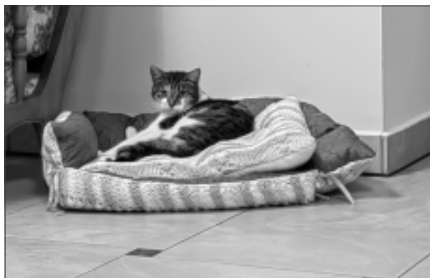
Kaķiem patīk. Dzīvnieku patversmē kaķi jau iemīlojuši jaunās guļvietas.