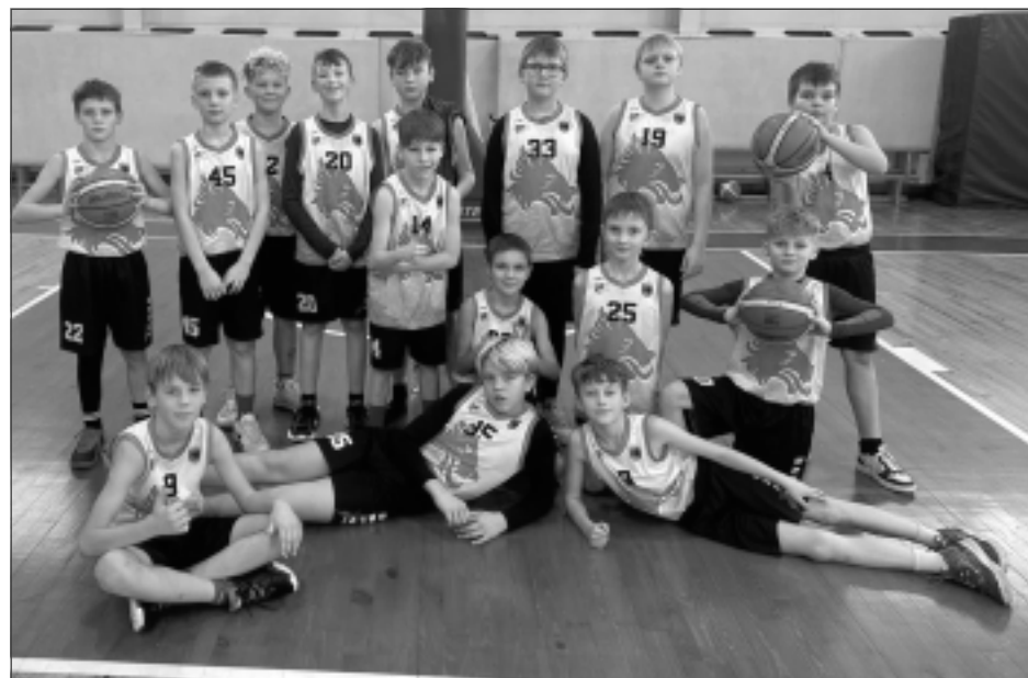
Balvu Sporta skolas "U-12" komanda. Puiši ir apņēmības gatavi doties pretī uzvarām arī turpmākajās spēlēs.

Tikmēr Balvu Sporta skolas "U-17" vecuma grupas zēnu komanda, lai uzsāktu Latvijas Jaunatnes basketbola līgas regulārās sezonas otro apli, devās uz Jēkabpili. Jau no spēles sākuma mājinieku komanda "Jēkabpils BJSS" pārņēma vadību un noturēja to līdz mača beigām. Šoreiz mūspuses basketbolistiem pietrūka cīņasspara un rakstura, līdz ar to tika