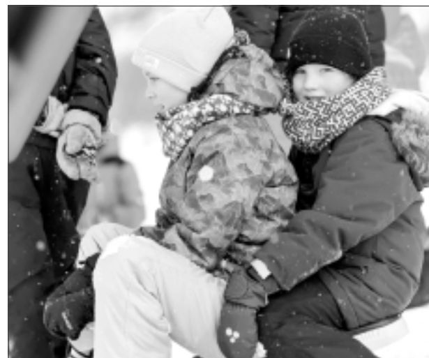
Atmiņas uz mūžu. Nometnes dalībnieki ar pilnu krūti metās šī gada ziemas piedāvātajās izpriecās, izbaudot dāsni uzsnigušo sniegu.