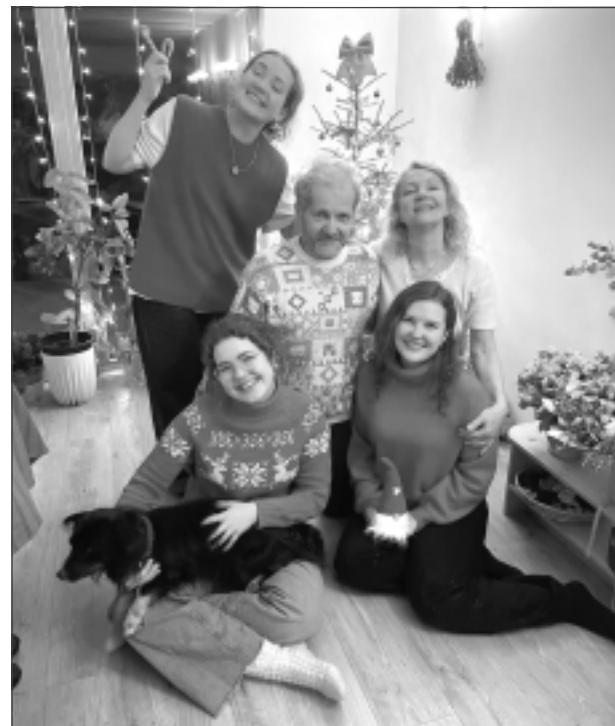
Ziemassvētki ir ģimenes laiks. Raibekazu saime garās svētku brīvdienas pavadīja kopā, ceļojot, svinot, izbaudot svētkiem izrotāto pilsētu krāšņumu un iemēģinot pirmos šī gada ziemas priekus.