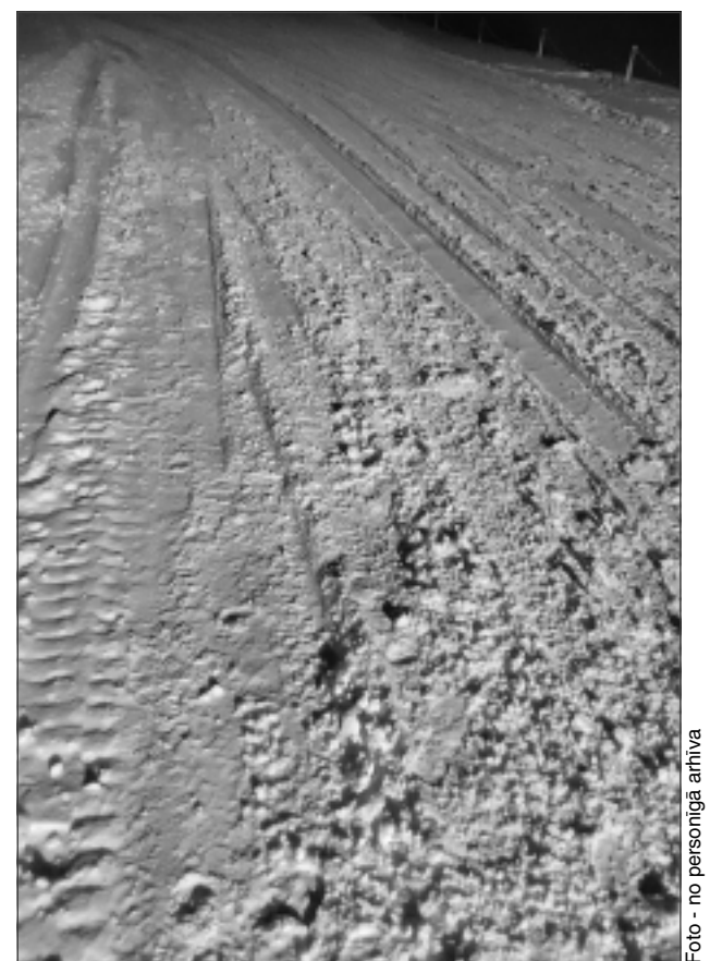
Sniegi sniga, putināja... Attēlā redzama viena no Žiguru piesnigušajām ielām šī gada sākumā.

Laikraksta "Vaduguns" kolektīvs aicina lasītājus arī turpmāk ziņot par dažādiem problēmjasautājumiem, novērojumiem un jebkādu citu aktualitāti, zvanot uz redakcijas tālruni-autoatbildētāju (64520961) vai informāciju un foto sūtīt uz e-pasta adresēm: vaduguns@apollo.lv vai ločmelis.arturs@gmail.com!