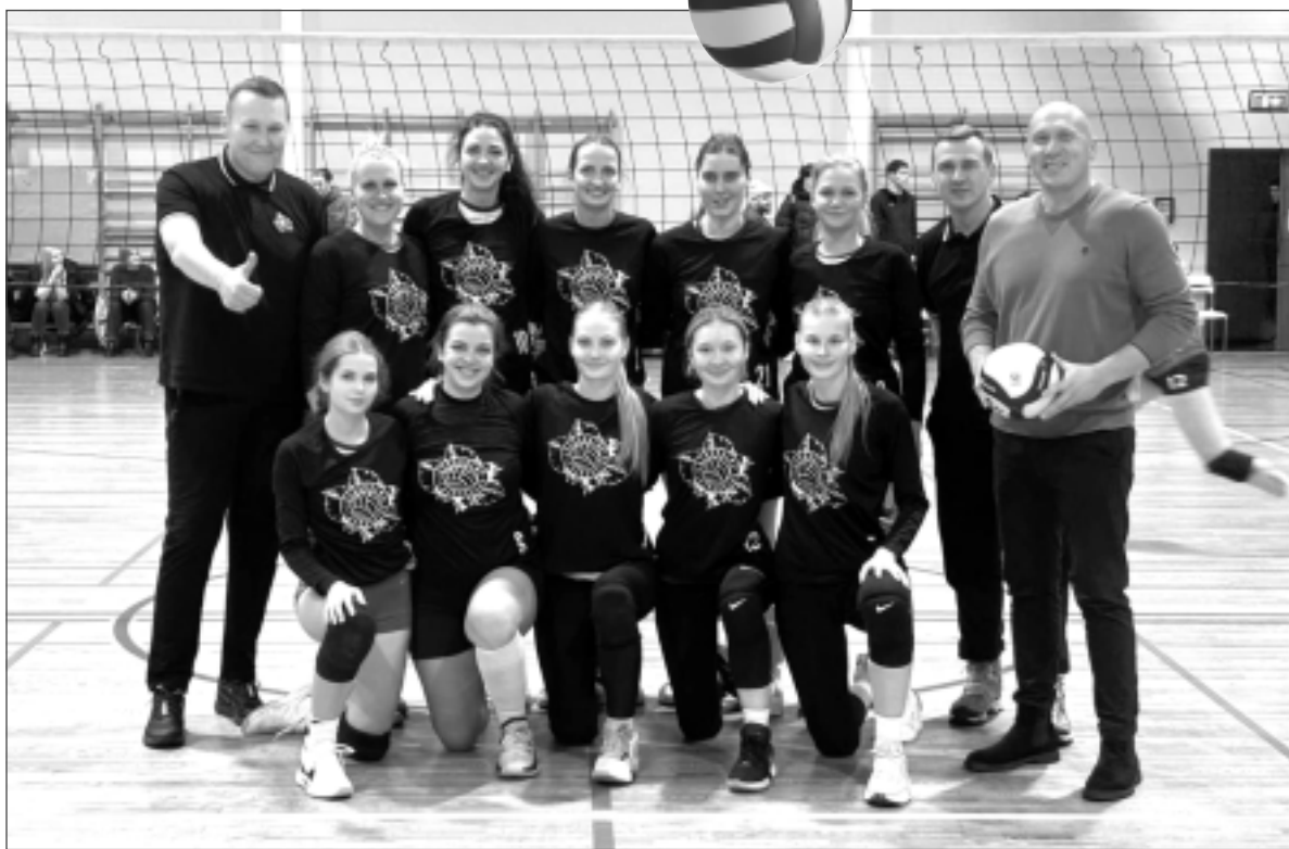
VK "Lazdukalns/Balvu novads" dāmu komanda. Meitenes 12.janvārī notikušos mačus Reģionālajā volejbola līgā aizvadīja Valmieras Pārgaujas sākumskolas sporta zālē.

Visbeidzot kārtējo sabraukumu Latvijas čempionāta vecuma grupā "Vīrieši 40+" aizvadījuši arī VK "Lazdukalns/Balvu novads"