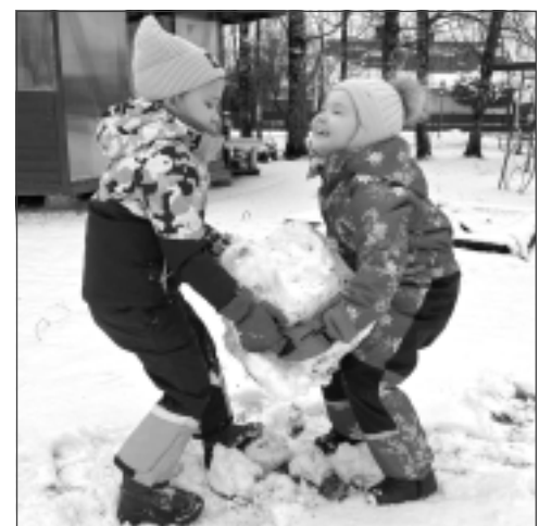
Sniega prieki. Sākumā tapa sniega bumbas, tad – apaļi sniegavīri.