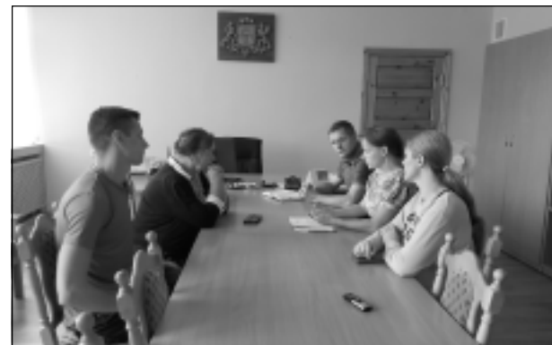
Tiekas ar novada vadītāju. "Ja ne mēs, tad kas?" sprieda bērnu vecāki.

Vēl viena sāpe, kas uztrauc īpašo bērnu vecākus, ir tā, ka pašreiz bērniem nav iespējas mācīties uz vietas Balvos. Viņiem jāvēro ceļš uz blakus pagastiem vai novadiem, kamēr Balvu Profesionālajā un vispārīgizglītojošajā vidusskolā, kas ir vienīgā