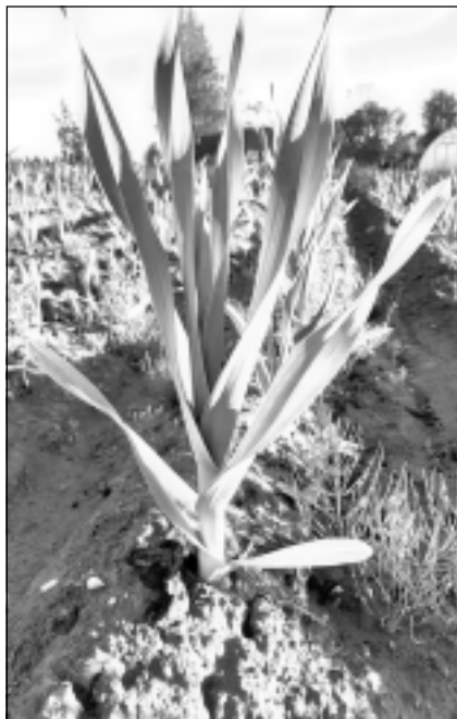
‘Ziloņķiploki’ vēl gatavojas. Šī šķirne, kā atklāj saimniece, ir grūtāk audzējama, arī sēklas materiāls ir dārgs, augus ir grūtāk pavairot no milzīgajām 3-4 daivām, kas tajos parasti nobriest.