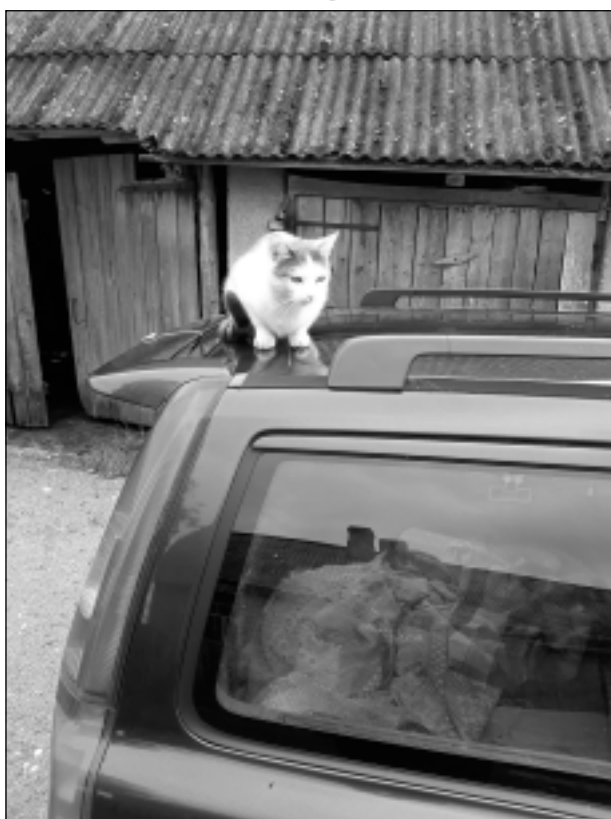
Novēro visu no augšienes.

Katra mēneša labākās fotogrāfijas autors saņems balvu. Fotogrāfijas var iesūtīt pa pastu – Balvi, Teātra ielā 8, LV-4501, vai elektroniski – vaduguns@apollo.lv. Pie foto obligāti norādāms vārds, uzvārds (vēlams - tālrunis).