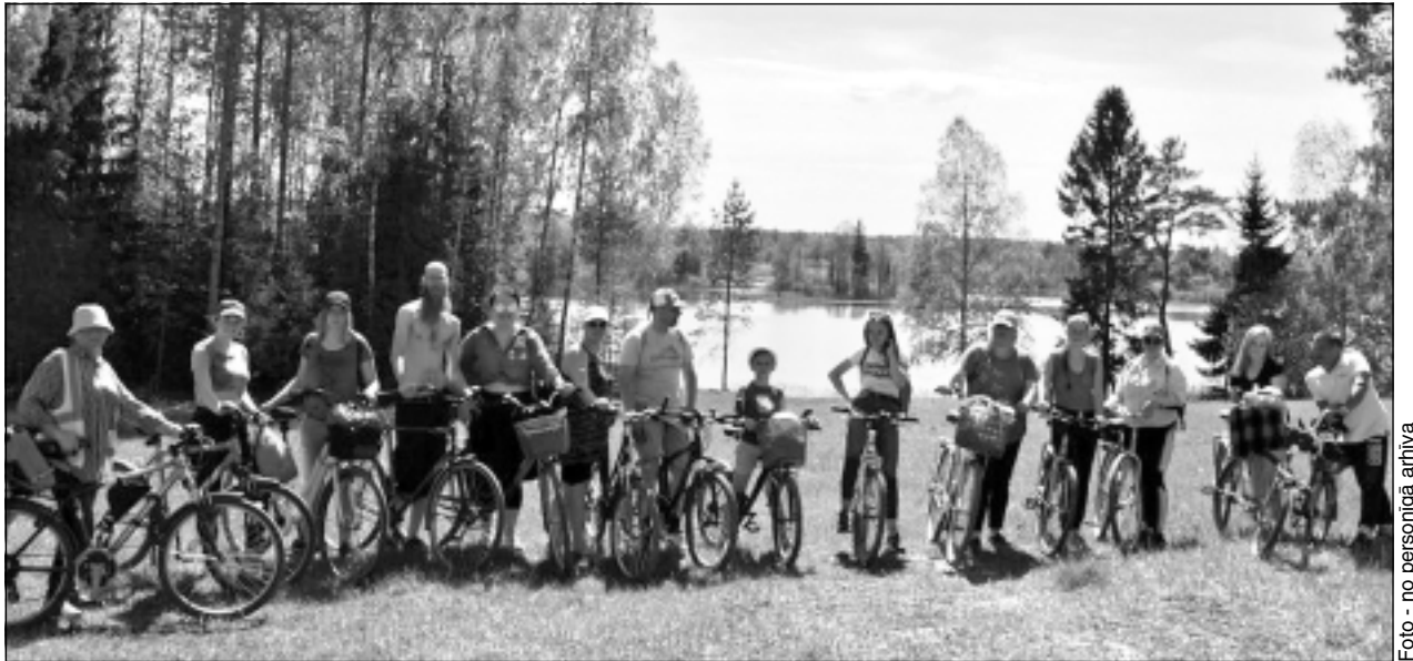
Pie Tepeniņas ezera. Viens no velobrauciena pieturas punktiem bija Susāju pagasta gleznainais Tepeniņas ezers. Kā lai nepiestāj un nenofotografējas?!