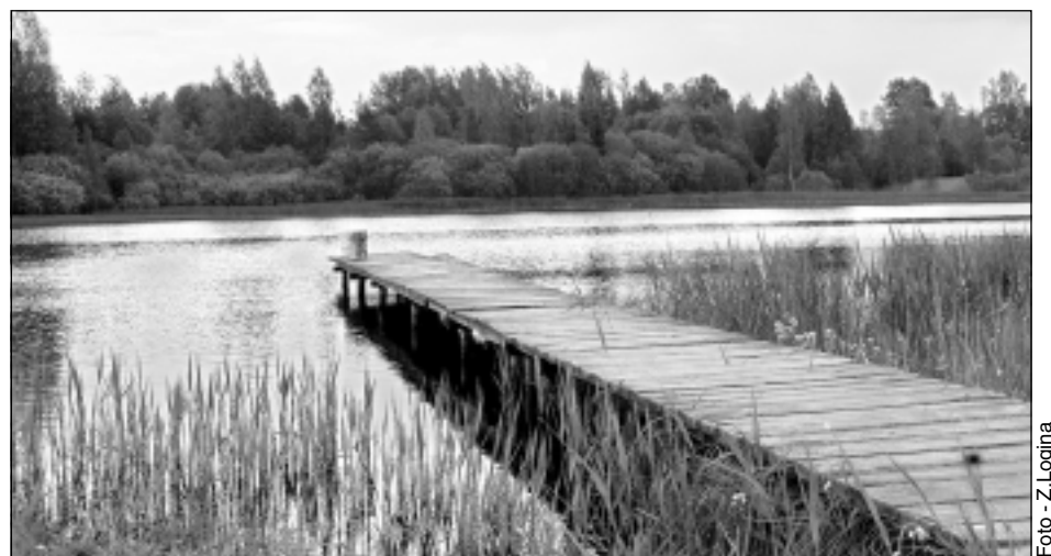
Naudaskalna ūdenskrātuve. Šogad Naudaskalna ūdenskrātuvei aprit 50 gadi. Tā ir 1,30 metrus dziļa un 3,7 hektārus liela.