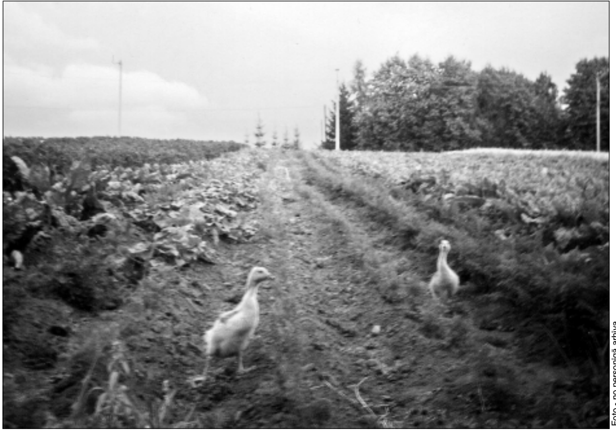
Žaļo un aug. Albums glabā foto no agrāko gadu darba ikdienas. Prasmīgiem saimniekiem vienmēr izauga dāsna raža.

-Sen zināma patiesība, ka lopu ēdienkarte nosaka dzīvnieka asins sastāvu, bet tas ietekmē produkcijas kvalitāti visos parametros. Lai saražotu garšīgu pienu, gaļu vai olas, dzīvnieki jāēdina garšīgi. Ar stiebru zālāju sienu, puscukurbietēm, burkāniem, kukurūzu, pašražotu spēkbarību, kas pārsvarā ir