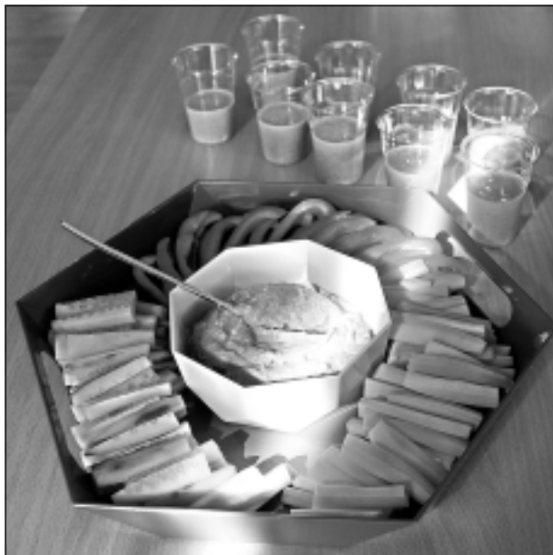
Izskatās skaisti un ļoti garšo. Receptes bija interesantas: gatavoja šokolādes trifeles, smūtiņu ar mandeļu pienu un zaļumiem un arī humusu ar dārzeņu stieniņiem. Parasti pārsteigumu sagādā iepazīšanās ar turku zirņu izmantošanu, no kuriem, kopā ar citām sastāvdaļām sablendējot, sanāk sārtīgs humuss.

dārzeņi. Šādas receptes ļauj iepazīties arī ar produktiem, ko dažkārt, kā esmu novērojusi, cilvēki nepazīst un neizmanto. Nepērk un neizmanto, piemēram, turku zirņus, zemesriekstu sviestu, kas ir olbaltumvielu un labo tauku avots. Man patīk, ka pēc šādām meistarklasēm atrodas cilvēki, kuri piesaka vizīti pie uztura speciālista. Var noklausīties un zināt vispārīgus uztura principus un receptes, taču visiem viss nekad nederēs. Labāk būtu katram izvēlēties tieši viņam noderīgus vajadzīgos produktus.