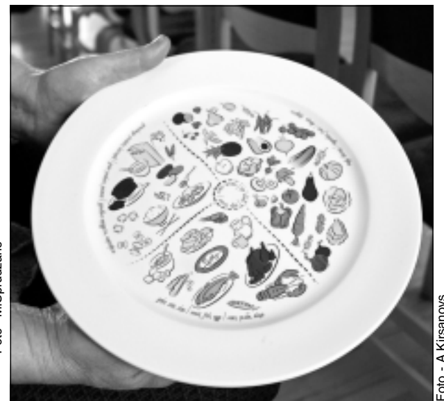
Kas tas par šķīvi? Varētu teikt – šķīveris ēdienreizēm, kā būtu pareizi veidot savas maltītes. Tas ir veselīga uztura šķīvis OnPlate, izstrādāts pēc uztura pamatnostādņiem. Šķīvis ir ar speciāliem iedalījumiem, kas atspoguļo atsevišķas uzturvielu grupas, turklāt nodrošina optimālu porcijas lielumu. Produkta komplektā ietilpst šķīvis OnPlate, ēdienkartes piemērs, ko var izmantot kā paraugu, un ieteicamo produktu saraksts šķīvja lietošanai ilgtermiņā. Uztura speciāliste saka, ka šķīvis palīdzēs iekļauties dienā ieteicamo kaloriju daudzumā, pareizi izvēlēties no katras produktu grupas, līdz ar to ēst pilnvērtīgi un saglabāt veselīgu svaru. Puse šķīvja jāpiepilda ar dārzeņiem un augļiem, ceturtdaļa - ar ogļhidrātu avotu un atlikusi ceturtdaļa - ar olbaltumvielu avotu.

-Viss atkarīgs no paša klienta, -cik daudz viņš vēlas runāt. Produktīva konsultācija, kad varam izrunāties abas puses, aizņem no 40 minūtēm līdz pat stundai. Man, protams, nav burvju nūjiņas vai tabletes, kas veicinās vielmaiņu un viss notiks ātri. Galvenais - lai cilvēkam pašam ir motivācija rīkoties. Pēc savas pieredzes, esot saskarsmē ar dažāda vecuma un abu dzimumu cilvēkiem, esmu novērojusi, ka sievietei lielāko motivāciju dod bērns, kas viņu uzliek uz pareizā ceļa, bet vīrietim - savs spoguļattēls. Tie ir mani novērojumi. Gribētos, lai arī ģimenes ārsti pacientiem iesaka vizīti pie uztura speciālista, jo pareizam