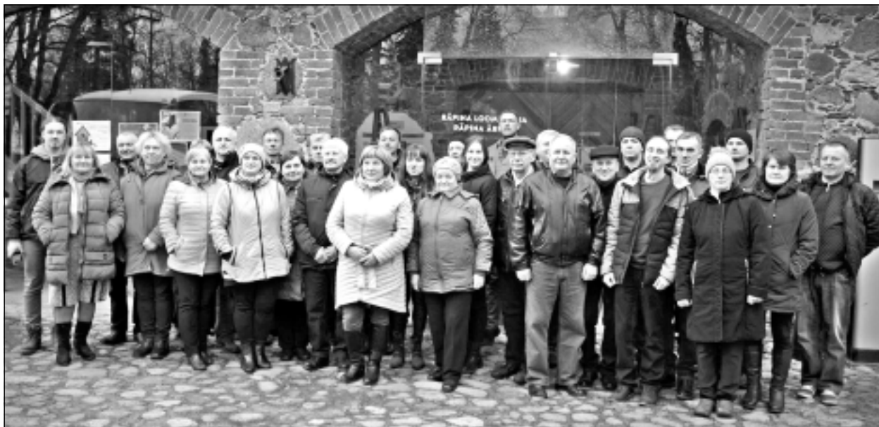
Vērtīgs brauciens. Atpakaļceļā uzņēmēji dalījās ar dienas laikā redzēto un izsecināja, ka šādi pieredzes braucieni jāorganizē regulāri.

"Brauciena dalībniekiem bija iespēja iepazīties arī ar tūrisma kompleksu SIA "Beneport", kas atrodas pašā Peipusa ezera krastā. Saimnieki izrādīja teritoriju un viesu namu, kuru rotāja dažādas mednieku trofejas un 18.gs. zirgu rati. Pabijām arī zvejniecības uzņēmumā SIA "Latikas", kas ražo zivju konservus no loma, kas noķerts Peipusa ezerā," stāsta S.Komane. Kopumā šajā uzņēmumā strādā 70 darbinieki, no kuriem 42 ir zvejnieki. Uzņēmuma vadītājs izrādīja ražotni un noslēgumā visiem bija iespēja degustēt gardo lomu, kūpinājumus un citas zivju marinādes.