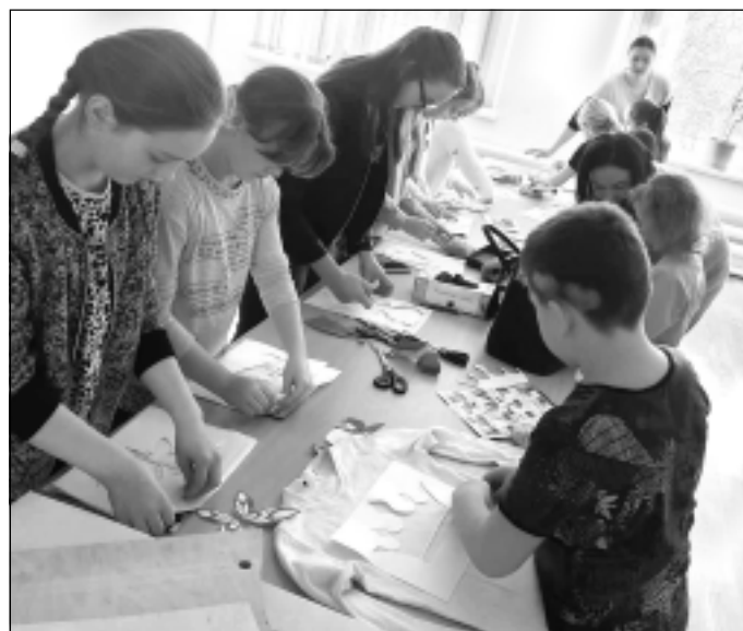
Vajag tikai audumu, trafaretu un krāsu. Izrādījās, ka auduma apdrukai izveidot nav sarežģīti, tomēr šim darbam nepieciešama pacietība un precizitāte.