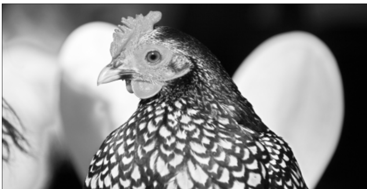
Vai Liieldienas tuvojas? Iesūtīja Jānis no Balviem.

Katra mēneša labākās fotogrāfijas autors saņems balvu. Fotogrāfijas var iesūtīt pa pastu – Balvi, Teātra ielā 8, LV-4501, vai elektroniski – vaduguns@apollo.lv. Pie foto obligāti norādāms vārds, uzvārds (vēlams - tālrunis).