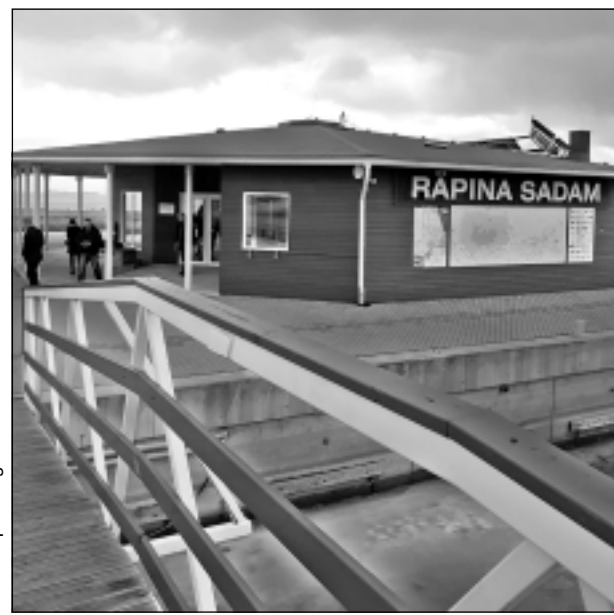
Ostas piestātne. Pateicoties dažiem entuziastiem, no aizaugušas vietas nepilnu 10 gadu laikā izveidota mūsdienu laivu piestātne, sakārtots piebraucamais ceļš, izveidota sala ar telpu pasākumiem, kur vasarā var iegādāties saldējumu. Lai tas viss īstenotos dzīvē, realizēti septiņi projekti.