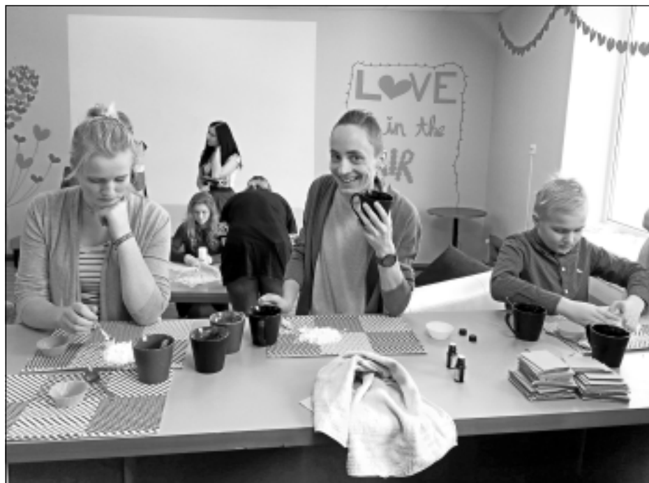
Izmēģina kaut ko jaunu. Lai vannošanās būtu patīkamāka, paši savām rokām samīcīt aromātiskas vannas bumbas mēģināja arī konkursa "Caur mūžiem Latgales karavīra piemiņa ir dzīva" radošo darbnīcu dalībnieki.