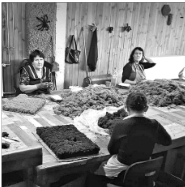
Sūnu dekoru ražotnē. Uzņēmumā pastāstīja, ka šeit ražo dažādus sienas dekorus no sūnām un šo produktu 100% eksportē uz Somiju, Zviedriju, Norvēģiju un Dubaju. Viens kvadrātmeters sūnu paklāja ir ļoti dārgs. Tas maksā, sākot no 600 eiro.