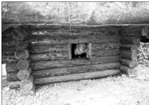
Rūķiņa namiņa. Iesūtīja Leontina Dukaļska no Balviem.

Katra mēneša labākās fotogrāfijas autors saņems balvu. Fotogrāfijas var iesūtīt pa pastu – Balvi, Teātra ielā 8, LV-4501, vai elektroniski – vaduguns@apollo.lv . Pie foto obligāti norādāms vārds, uzvārds (vēlams - tālrunis).