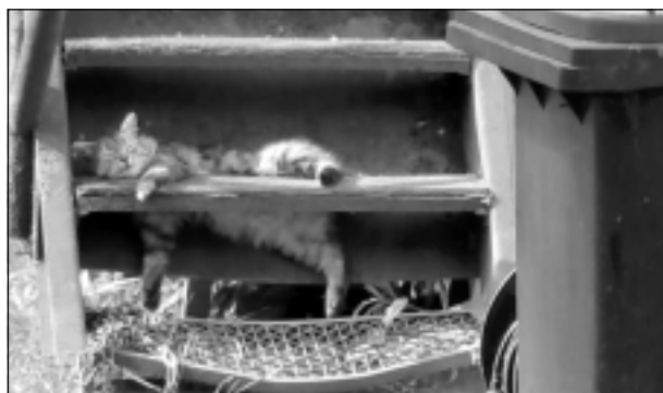
Pēc smagas darba dienas.