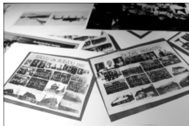
Vēsture interesē. Rotko centra izstāžu apmeklētāji ar interesi aplūkoja kopijas no albuma, kurās redzama mūspuses pagastu vēsture.