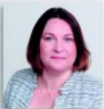
2. Inese Laizāne Latvijas Republikas 12. Saeimas deputāte