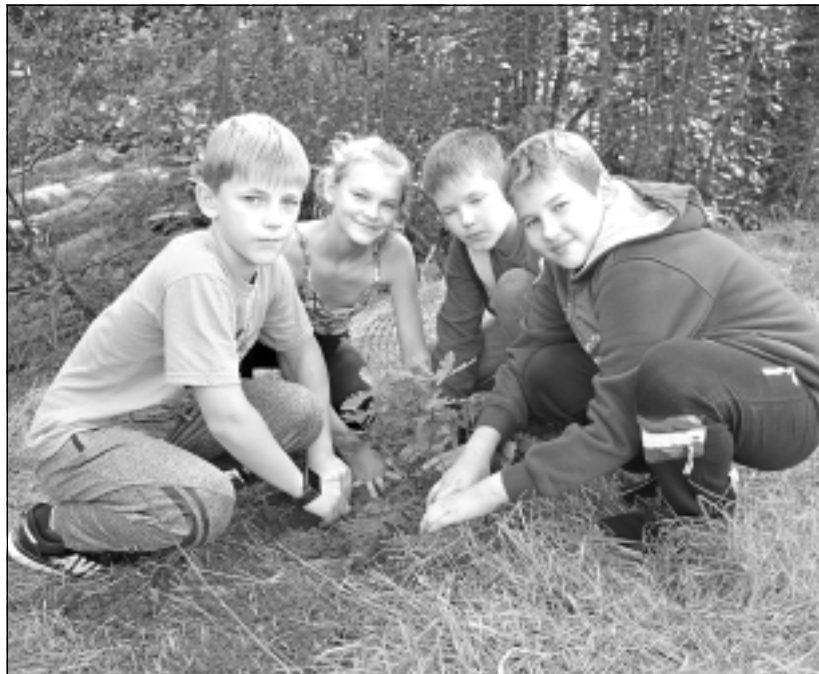
Stāda ozoliņus. Jaunos ozoliņus Pliešovā iestādīja Baltinavas vidusskolas 5.klases skolēni. Viņi ap katru kociņu uzlika aizsargsietu, lai tos nenoposta dzīvnieki. Lai aug, pieņemams kuplumā un spēkā!

Der pieminēt, ka jaunie ozoliņi izaudzēti skolas dārzā no ozolzilēm, ko skolēni un mazpulcēni savāca no Baltinavā augošajiem, raženajiem ozoliem akcijas