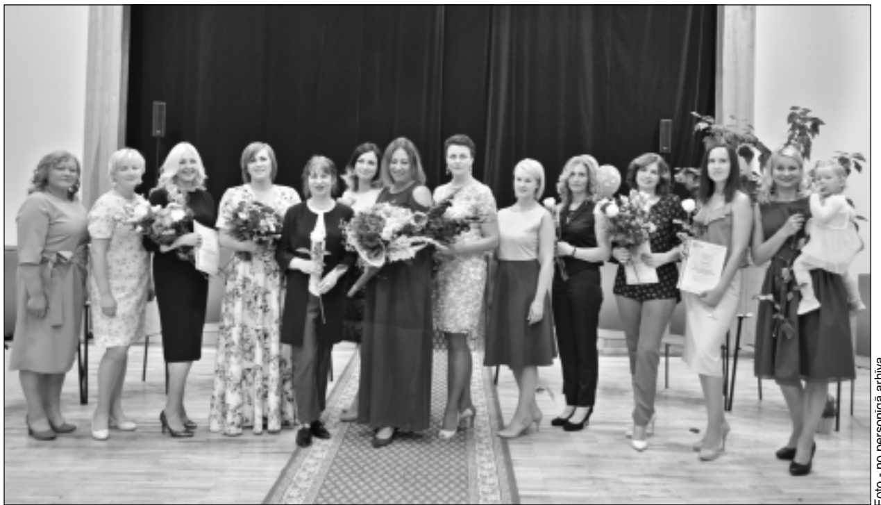
Pēc izlaiduma. Visas 12 pieaugušo izglītības programmas “Šūto un dekoratīvo izstrādājumu ražošanas tehnoloģija” audzēknes veiksmīgi pabeidza apmācības, saņemot ne tikai apliecības, bet arī iegūstot vērtīgas un katras sievietes dzīvē noderīgas zināšanas.

Mācību klasēs pavadījušas 80 stundas, 23.augusta vakarā programmas “Šūto un dekoratīvo izstrādājumu ražošanas tehnoloģija” absolventes svinēja izlaidumu. Pirms saņemt apliecības par veiksmīgi pabeigto apmācību, tuvinieku apsveikumus un ziedus, viņas izturēja vēl pēdējo eksāmenu, demonstrējot klātesošajiem 21 pašu izgatavoto tērpu.