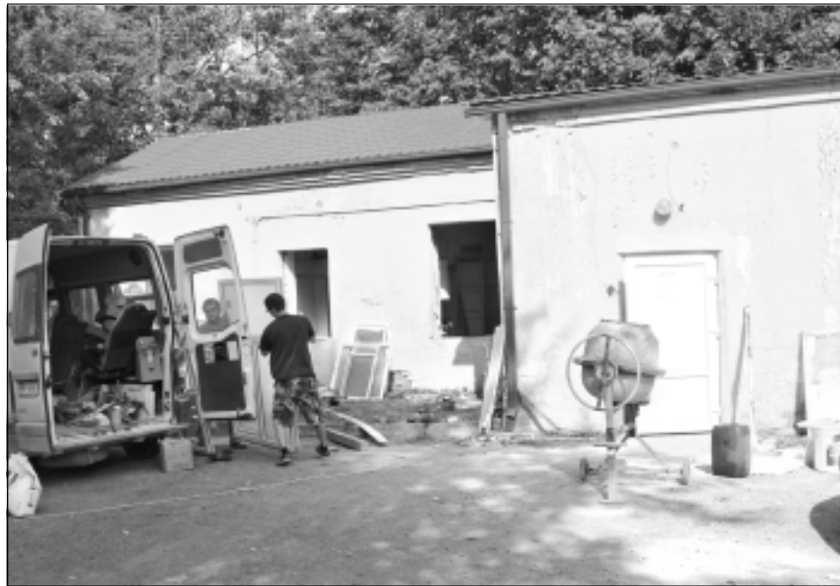
Balvu slimnīcas morgs. Tas darbību atsāks jau pavisam drīz.