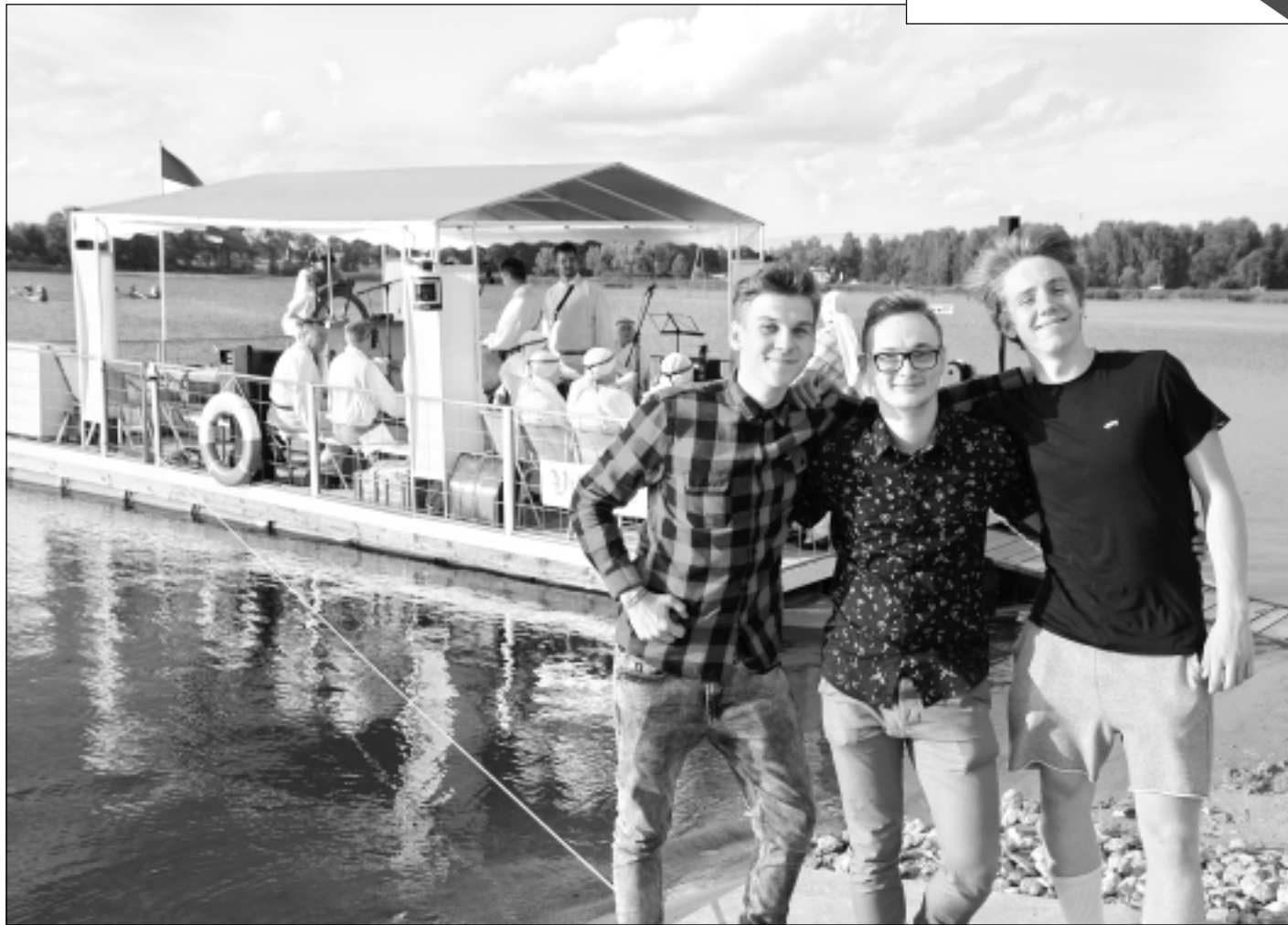
"Nepethe trio". Džeza mūzikas cienītāji no Rīgas neslēpa sajūsmu par iespēju uzstāties koncertzālē uz ūdens.

Sestdien "komandas.lv" 1.līgas spēlē Balvu Sporta centra komanda nospēlēja neizšķirti 1:1 ar futbola komandu "JDFS Alberts". Šo sestdien mūsējie spēkiem mērosies ar "BFC Daugavpils" futbolistiem, kuri šobrīd ieņem otro vietu turnīrā.