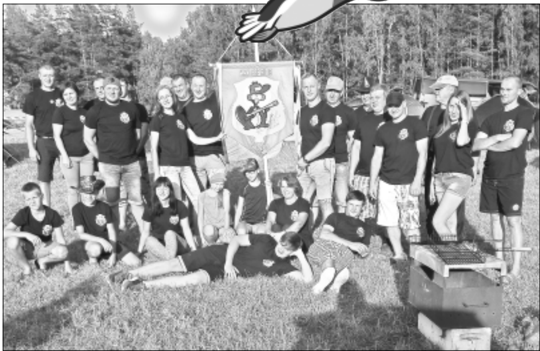
Komanda “Bebrītis”. Mednieku, makšķernieku kluba “Bebrītis” komanda Vislatvijas mednieku festivālā “Minhauzens 2018” piedalījās pirmo reizi. Rezultāts nav svarīgs, galvenais ir piedalīties, - pauzē dalībnieku apmierinātās sejas.

“Medniekiem vairāk jāstāsta par savu ieguldījumu tautsaimniecībā...”