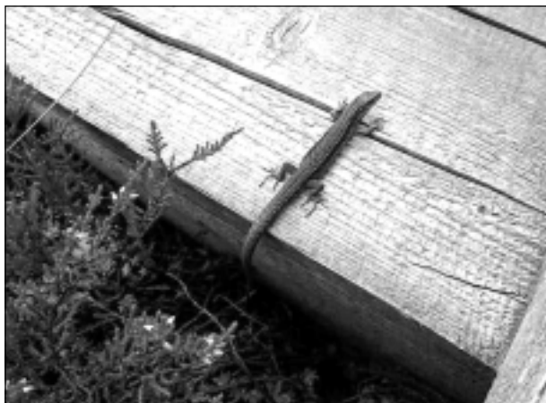
Kīrzaciņa. Iesūtīja Leontīna Dukaļska no Balviem.

Katra mēneša labākās fotogrāfijas autors saņems balvu. Fotogrāfijas var iesūtīt pa pastu - Balvi, Teātra ielā 8, LV-4501, vai elektroniski - vaduguns@apollo.lv. Pie foto obligāti norādāms vārds, uzvārds (vēlams - tālrunis).