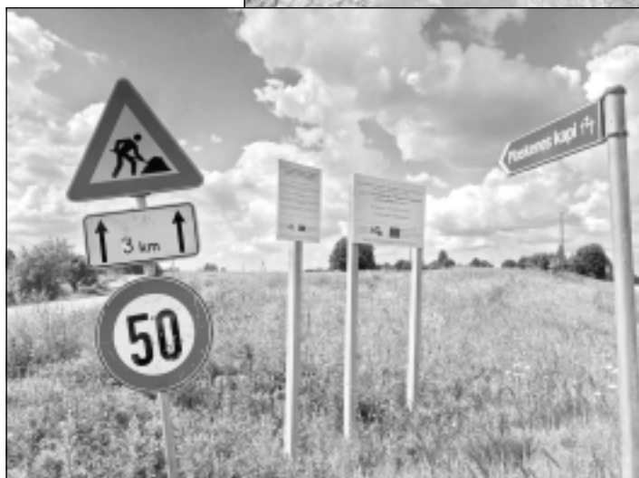
Dambergi – Ploskene – Augstasils. Saskaņā ar Ministru kabineta noteikumiem, kas saistīti ar Eiropas Savienības

atbalsta piešķiršanas kārtību pamatpalpojumiem un ciematu atjaunošanai lauku apvidos, katrai pašvaldībai noteikts maksimāli pieejamais atbalsta apmērs. Tas aprēķināts, ņemot vērā pašvaldības kopējo ceļu garumu, kopējo dzīvnieku skaitu un kopējās laukaugu platības. Balvu novada pašvaldībai maksimāli pieejamais atbalsta apmērs ir 1,58 miljoni eiro. Balvu novada pašvaldība informē, ka šo finansējumu arī turpmāk izmantos, lai veiktu grants ceļu pārbūvi Balvu novadā.