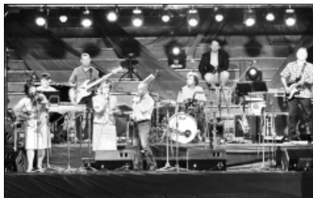
“Leijerkastnieki” atkal kopā.