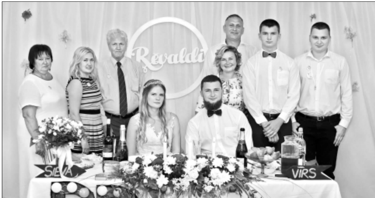
Rēvaldi. Kopbilde kāzās.