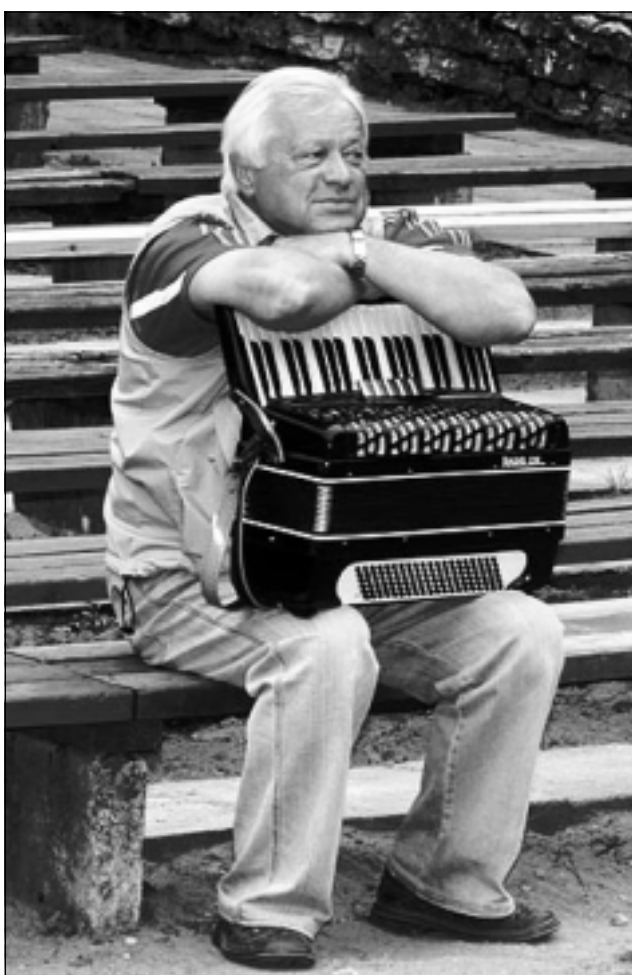
Latvijas Radio programmās regulāri skan "Leijerkastnieku" izpildītās dziesmas.