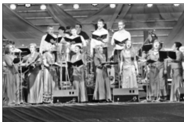
Kubulu vokālais ansamblis.