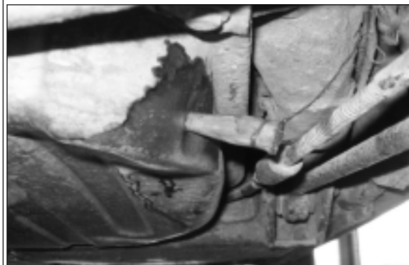
Ar koka tapu aizdarināta bāka.

Lai arī zemāk redzami attēli, visticamāk, nav konstatēti nevienā no mūšpusē novadiem, baisā realitāte uz ceļiem ikvienam autovadītājam atkārtoti atgādina, ar kādiem pretimbraucējiem un to iespējamajām sekām jāreķinās. Turklāt, vai var apgalvot, ka ar automašīnām tamlīdzīgā tehniskā stāvoklī kāds nepārvietojas arī pa Balvu, Viļakas, Rugāju vai Baltinavas ceļiem?