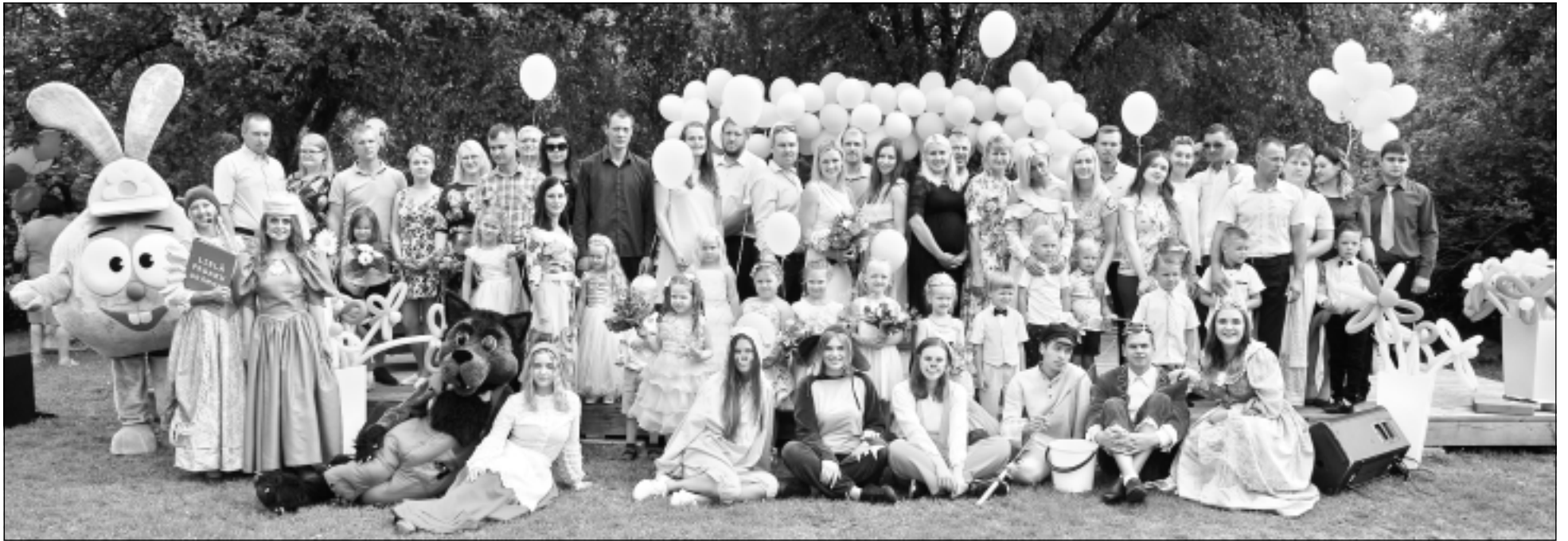
Foto piemiņai. Bērņības svētkos Balvos sumināja 32 bērņus.