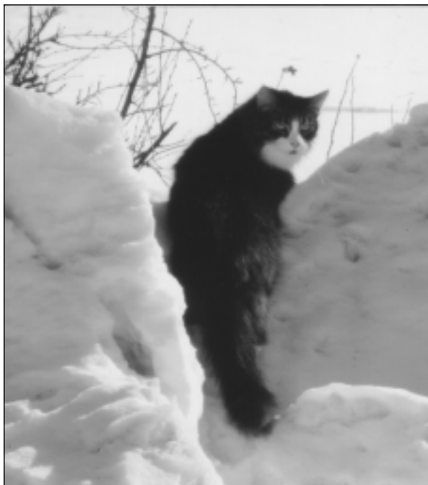
lesim vizināties! Iesūtīja Daniels Kivkucāns no Balviem.

Katra mēneša labākās fotogrāfijas autors saņems balvu. Fotogrāfijas var iesūtīt pa pastu - Balvi, Teātra ielā 8, LV-4501, vai elektroniski - vaduguns@apollo.lv. Pie foto obligāti norādāms vārds, uzvārds (vēlams - tālrunis).