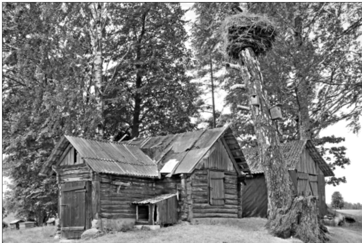
Gluži kā brīvdabas muzejā! Iebraucot Zālišu sētā, pārņem sajūta, ka esi nokļuvis brīvdabas muzejā. Mājas atrodas nepilnus desmit kilometrus no šosejas, no novada centra.