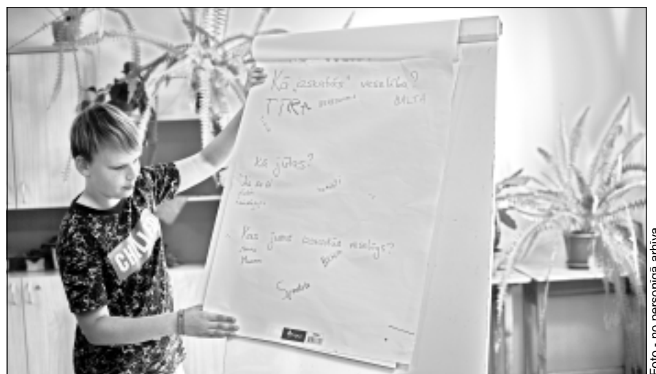
Kā izskatās veselība? Tīra? Balta? Uz šo un citiem jautājumiem par veselību nācās atbildēt teju visiem nometnes dalībniekiem.