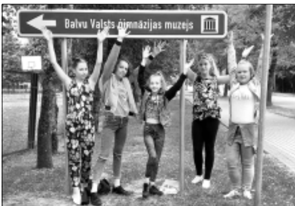
Fotoorientēšanās. Topošie ģimnāzisti, veicot dažādus fotoorientēšanās uzdevumus, labāk iepazīta skolu, kur rudenī uzsāks mācības.