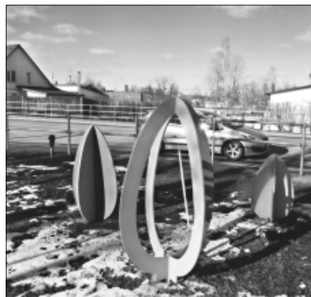
Balvos.