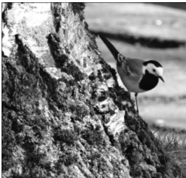
Latvijas nacionālais putns - baltā cielaviņa. Iesūtīja Leontīna Dukaļska no Balviem.

Katra mēneša labākās fotogrāfijas autors saņems balvu. Fotogrāfijas var iesūtīt pa pastu – Balvi, Teātra ielā 8, LV-4501, vai elektroniski – vaduguns@apollo.lv. Pie foto obligāti norādāms vārds, uzvārds (vēlams - tālrunis).