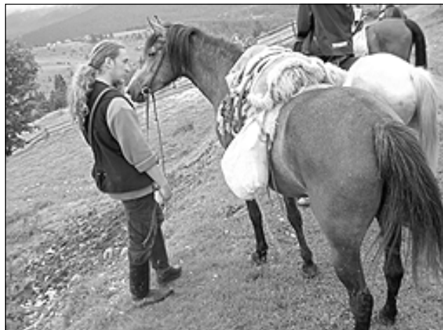
Pavadonis Žolta. Kādā pilsētiņā ceļniekus sagaidīja otrs pavadonis – jauns puisis vārdā Žolta ar savu burvīgo ķēvīti.