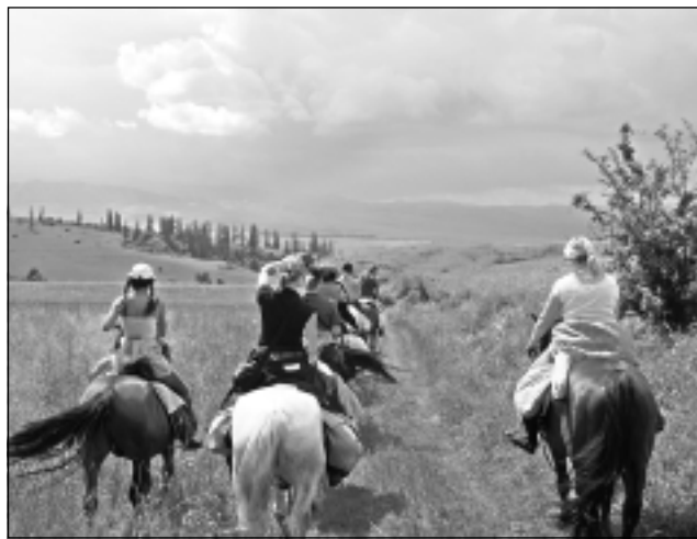
Miglas vālos zudušais kalns. Lai arī Transilvānijā saules spozme brīžiem mijās ar lietus lāsēm, vienreizējo dabas ainu pievilcību tas nemazināja.