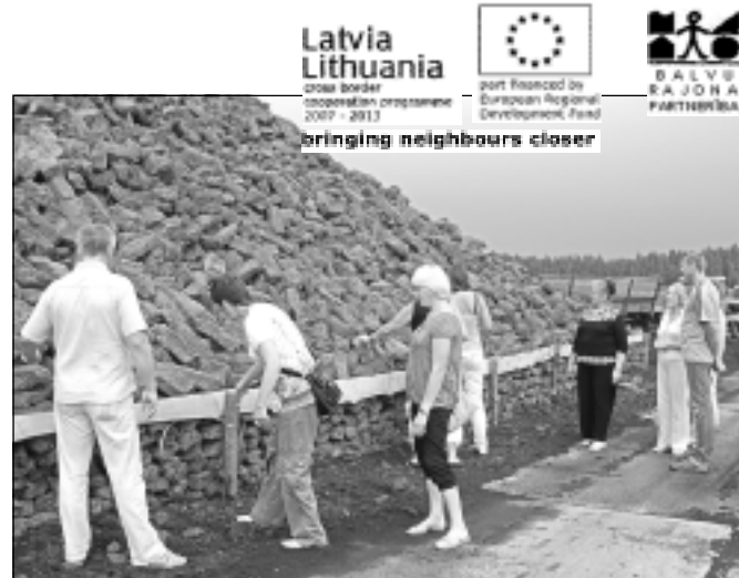
Kūdras purvā. Lietuvieši iepazīstas ar SIA "Balvi Flora" darbību.

"Patika, ka lietuvieši bija aktīvi un iesaistījās aktivitātēs. Viņi nebija vērotāji, bet bija aktivitāšu dalībnieki. Ar jauniešu deju kolektīvu šī bija jau otrā tikšanās, jo 2008.gadā tautas deju nometnes laikā tieši šis kolektīvs piedalījās nometnē. Liels prieks bija vērot, ka jaunieši savu