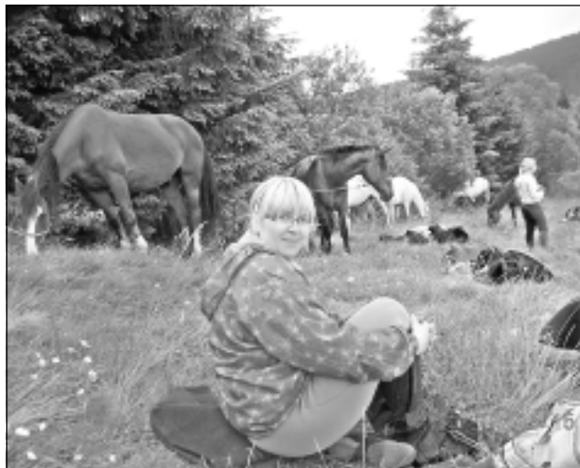
Piepilda sapni. Indras dzīvē vārds „zirgi” allaž bijis sinonīms vārdam „sapnis”. Nu viņas sapnis doties izjādē ar zirgiem ir piepildījies, realizētā sapņa kulminācijas punktu sasniedzot teiksmainajā Transilvānijas zemē.