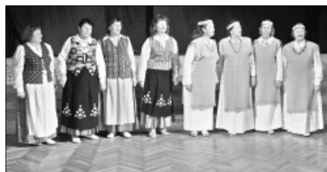
Dzied lietuvieši. Apvienotais divu folkloras kopu kolektīvs latviski dzied "Kur tu teci gailīti?"