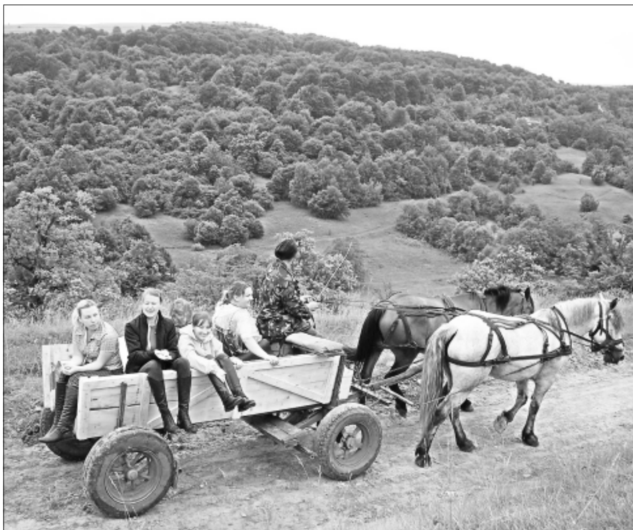
Ceļā uz pirmajiem piedzīvojumiem. Viena no pirmajām ceļojuma pieturvietām bija Stanas ciems, no kurienes ceļnieki zirgu vilktā orē devās baudīt Rumānijas zemes dabas valdzinājumu.