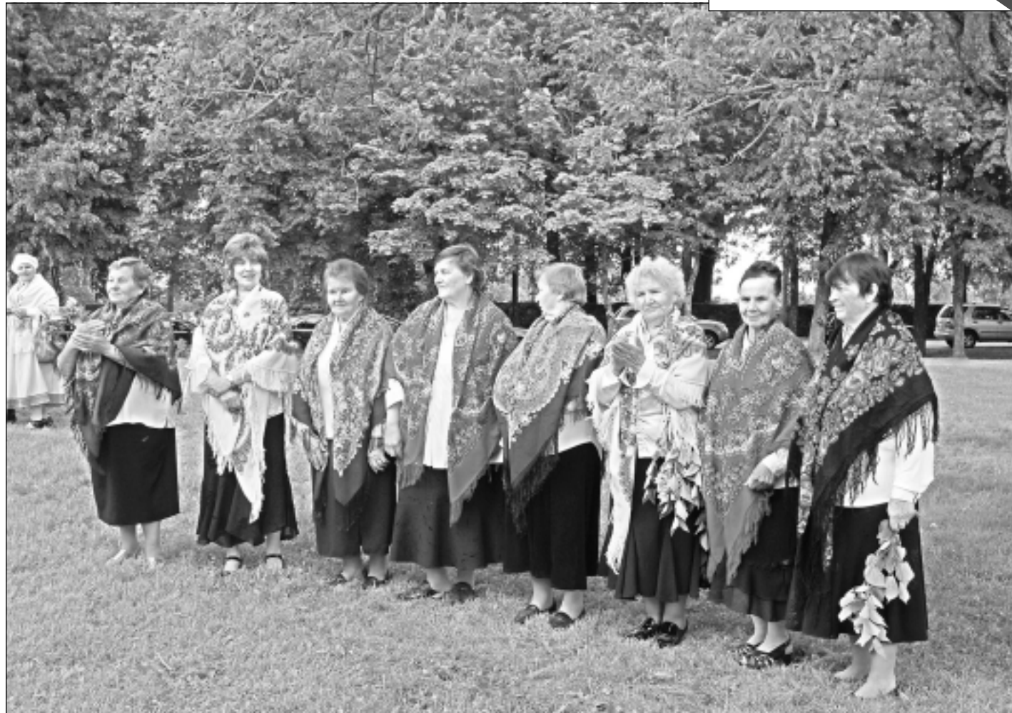
Vokālais ansamblis "Sudaruški". Tikai pirms pieciem gadiem dibinātais ansamblis jau pazīstams tālu aiz Viļakas robežām. Tagad krievvalodīgo dziedātāju daiļrades liecības iemūžinātas DVD un saglabātas nākamajām paaudzēm.

12. augustā plkst. 10.00 Sociālā servisa telpās notiks Balvu pilsētas pensionāru sapulce. Pensionāri spriedīs par turpmākajiem darbiem, tostarp par ekskursiju, kas plānota augustā.