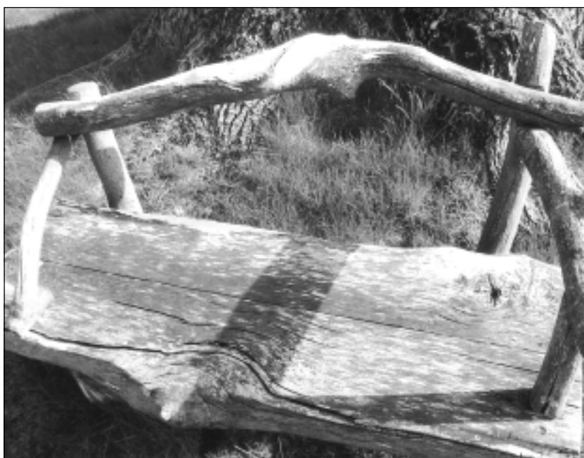
Orģināls soliņš. Iesūtīja Daniels Kivkucāns no Balviem.

Katra mēneša labākās fotogrāfijas autors saņems balvu. Fotogrāfijas var iesūtīt pa pastu – Balvi, Teātra ielā 8, LV-4501, vai elektroniski – vaduguns@apollo.lv . Pie foto obligāti norādāms vārds, uzvārds (vēlams - tālrunis).