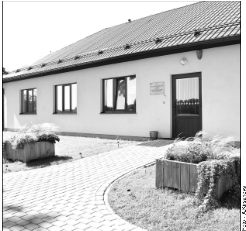
Sociālās aprūpes centrs "Rugāji" . Ar novada domes lēmumu juridiski tas pievienots Sociālajam dienestam, kļūstot par struktūrvienību.

Skaidrojums ļauj saprast, ka šobrīd aprūpes centra vadītāja neveic tādas pienākumus kā iestādes finansu, personāla un citu resursu pārvaldi, nenosaka iestādes pārvaldes amatpersonu un darbinieku pienākumus,