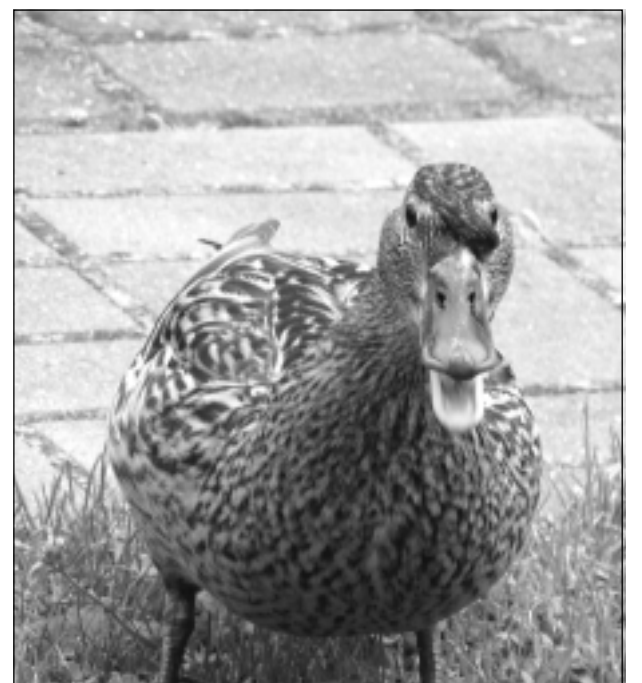
Paldies par pusdienām! Iesūtīja Leontīne Dukaļska no Balviem.