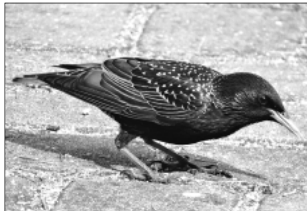
Es arī ēdu maiziti... Iesūtīja Leontīne Dukaļska no Balviem.

Katra mēneša labākās fotogrāfijas autors saņems balvu. Fotogrāfijas var iesūtīt pa pastu – Balvi, Teātra ielā 8, LV-4501, vai elektroniski – vaduguns@apollo.lv. Pie foto obligāti norādāms vārds, uzvārds (vēlams - tālrunis).