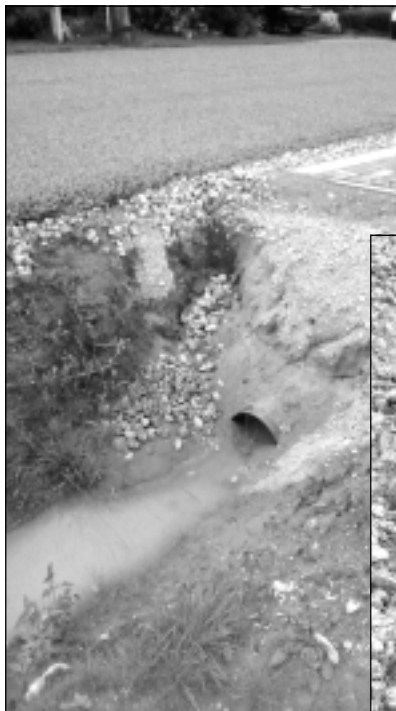
Caurule pēc lietus.

Remontdarbiem noslēdzoties, ielas malas grāvī vēl pirms nedēļas pavērās šāds skats. Pēc lietavām no nenostiprinātās ceļa malas nogruvušās smiltis cauruli bija aizdambējušas līdz pusei.