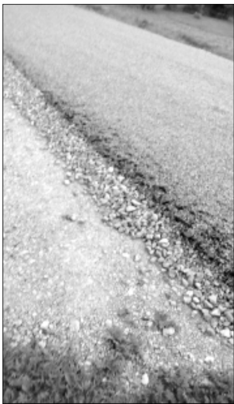
Stāvs kritums. Vienā Ceļinieku ielas pusē jaunais segums atrodas vairākus centimetrus augstāk nekā pati ceļmala. Kā tas ietekmēs automašīnu, kas vēlēšies noparkoties ielas malā, seciniet paši.