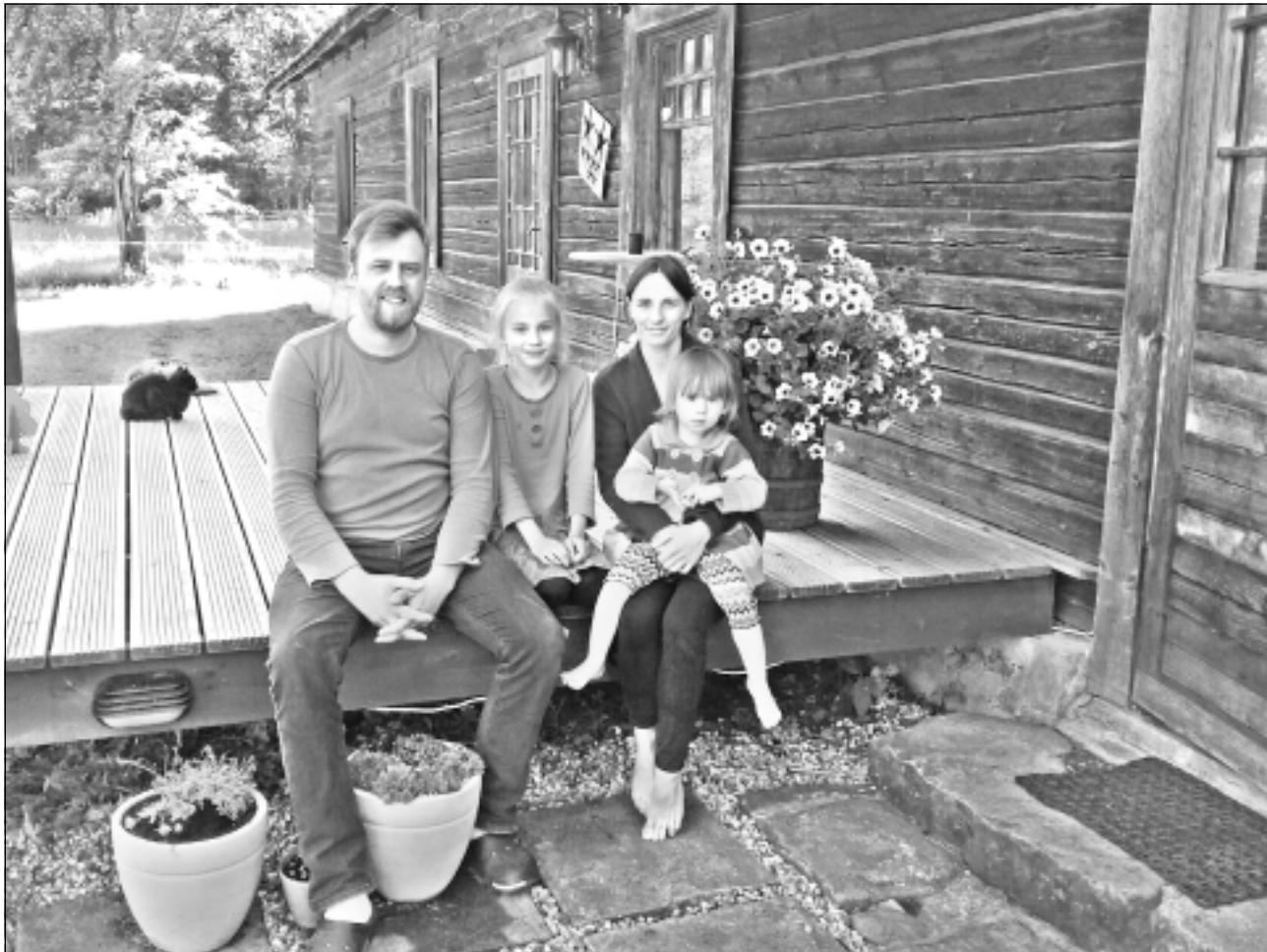
Idille laukos. Brūveru ģimene no Cēsīm uz Rugāju novadu pārcēlusies, jo viņiem svarīgi dzīvot mierā, harmonijā un klusumā. "Dreimanovu" mājās viņiem tas izdodas.