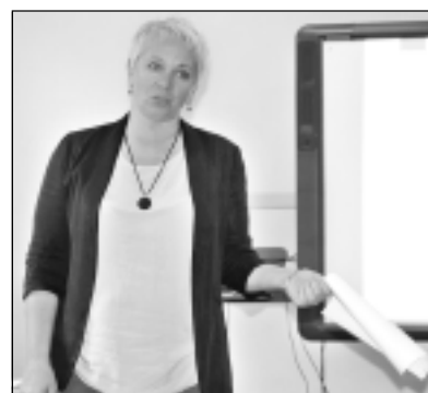
Seminārā. Valsts policijas Sabiedrisko attiecību nodaļas vadītāja Sīgita Pildava (attēlā) seminārā runāja par

tiesībsargājošo iestāžu un mediju sadarbību, sabiedrības tiesībām zināt, upura tiesībām uz anonimitāti un citiem aktuāliem jautājumiem.