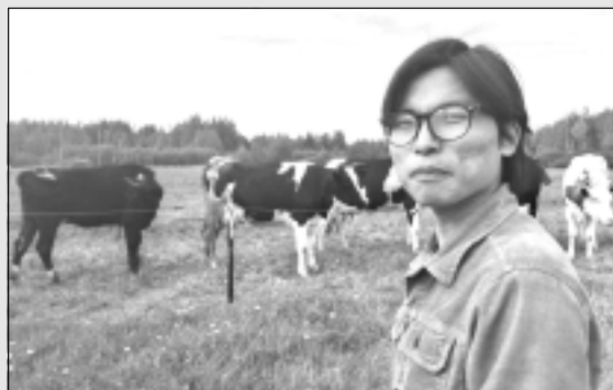
Pirmo reizi Eiropā, Latvijā un arī Balvos.