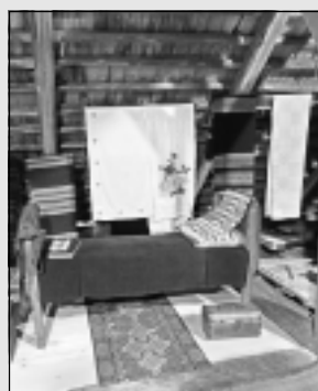
Seniori iepazīst Viļakas novadu.