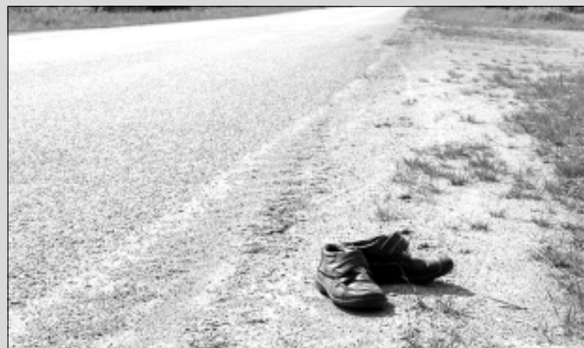
Lazdulejas pagastā. Kur palicis vēlētājs?