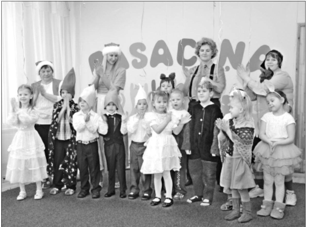
Foto piemiņai. Pēc svētku koncerta, kas veltīts “Pasaciņas” 20 gadu jubilejai.