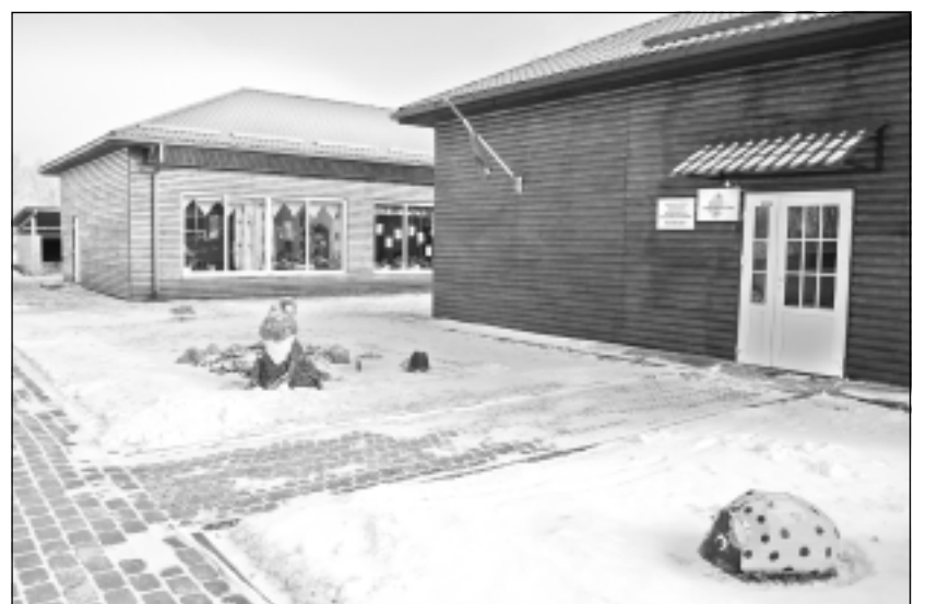
Divdesmit vai vairāk gadu? 1997. gada 13. janvārī trīsstāvu daudzdzīvokļu namā atvēra jaunu bērnudārzu “Pasaciņa”, kas atradās četrstābu dzīvoklī. Tur arī nosvinēja “Pasaciņas” 5 gadu jubileju. Patiesībā bērnudārzs Medņevā pastāv daudz ilgāk (foto).