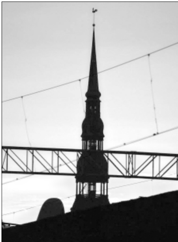
Galvaspilsētā. Iesūtīja Rinalds Martiņenko.