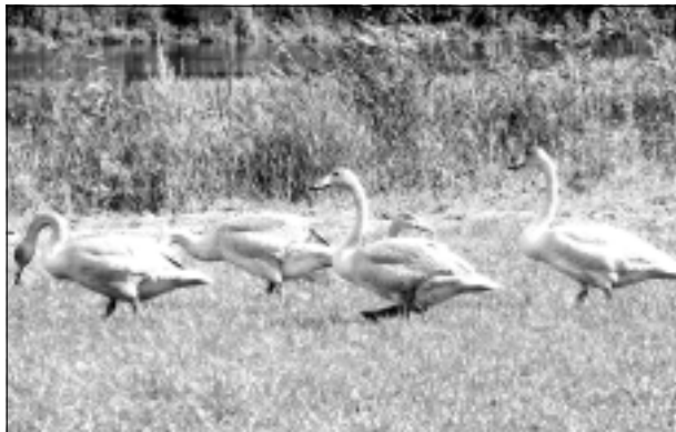
"Vienā rindā stāties!" Iesūtīja Daniels Kivkucāns no Balviem.

Katra mēneša labākās fotogrāfijas autors saņems balvu. Fotogrāfijas var iesūtīt pa pastu - Balvi, Teātra ielā 8, LV-4501, vai elektroniski - vaduguns@apollo.lv. Pie foto obligāti norādāms vārds, uzvārds (vēlams - tālrunis).